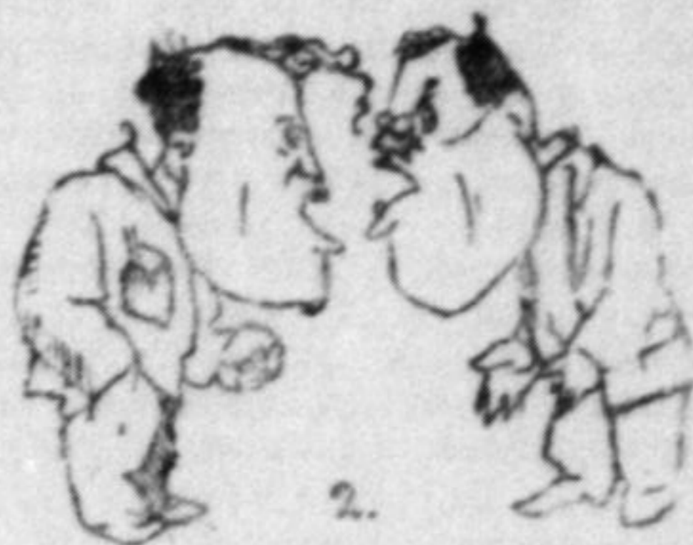
По році дискусії.