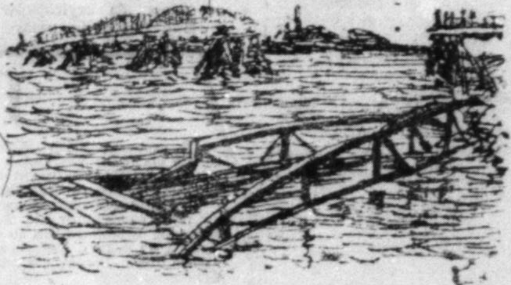
Наша ілюстрація представляє великий залізничний міст на Дунаю між Найзацом і Петроварадином, зірваний цими днями кригою.