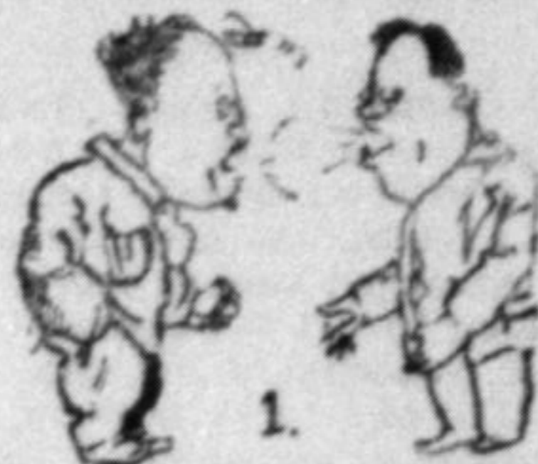
По першій місяці дискусії.

Як відомо большевики дуже багато говорять. Мітінгів, нарад, конференцій у них тьма тьменна. Як так далі піде, то