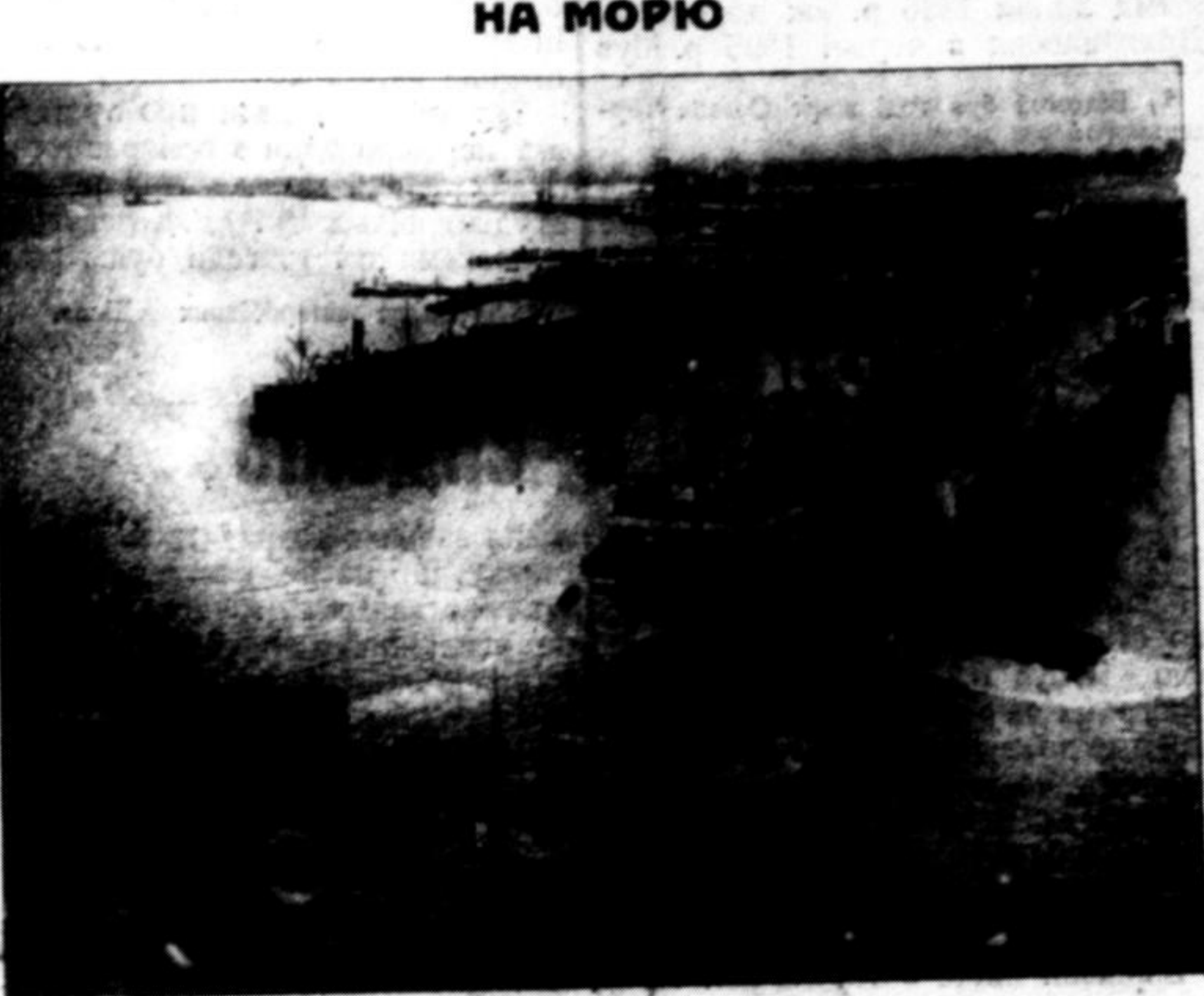
Великий корабель «Кунард-ліній» «Мавританія» (60.000 тон поємности) причалоє до берегів Подунав'я Англії, щоби піддатися репарації у корабельних верстатах. Видит техніки на морі...