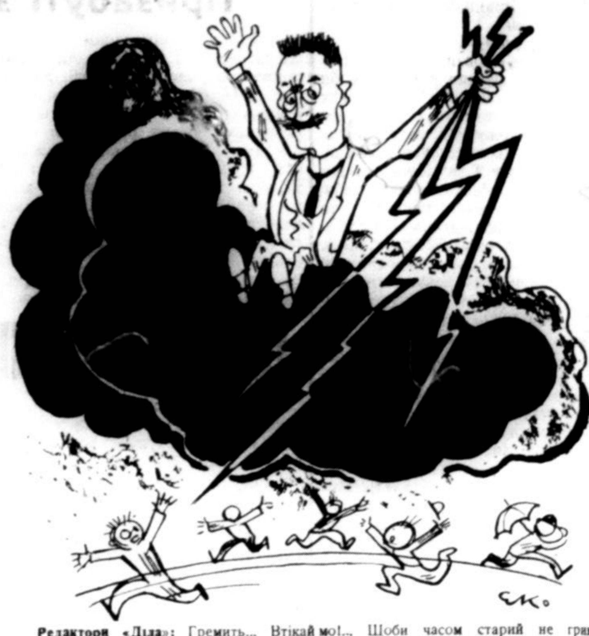
Редактори «Діло»: Гремиць... Вітаймо!... Щоби часом старий не грамух нас якою блискавкою...

«Новий Час» назвав автора повістки «Гремиць», виданої в «Українській Бібліотечі», знагоди його споминів «спречкою націоналізму». Цьому спротивлявся «Діло».