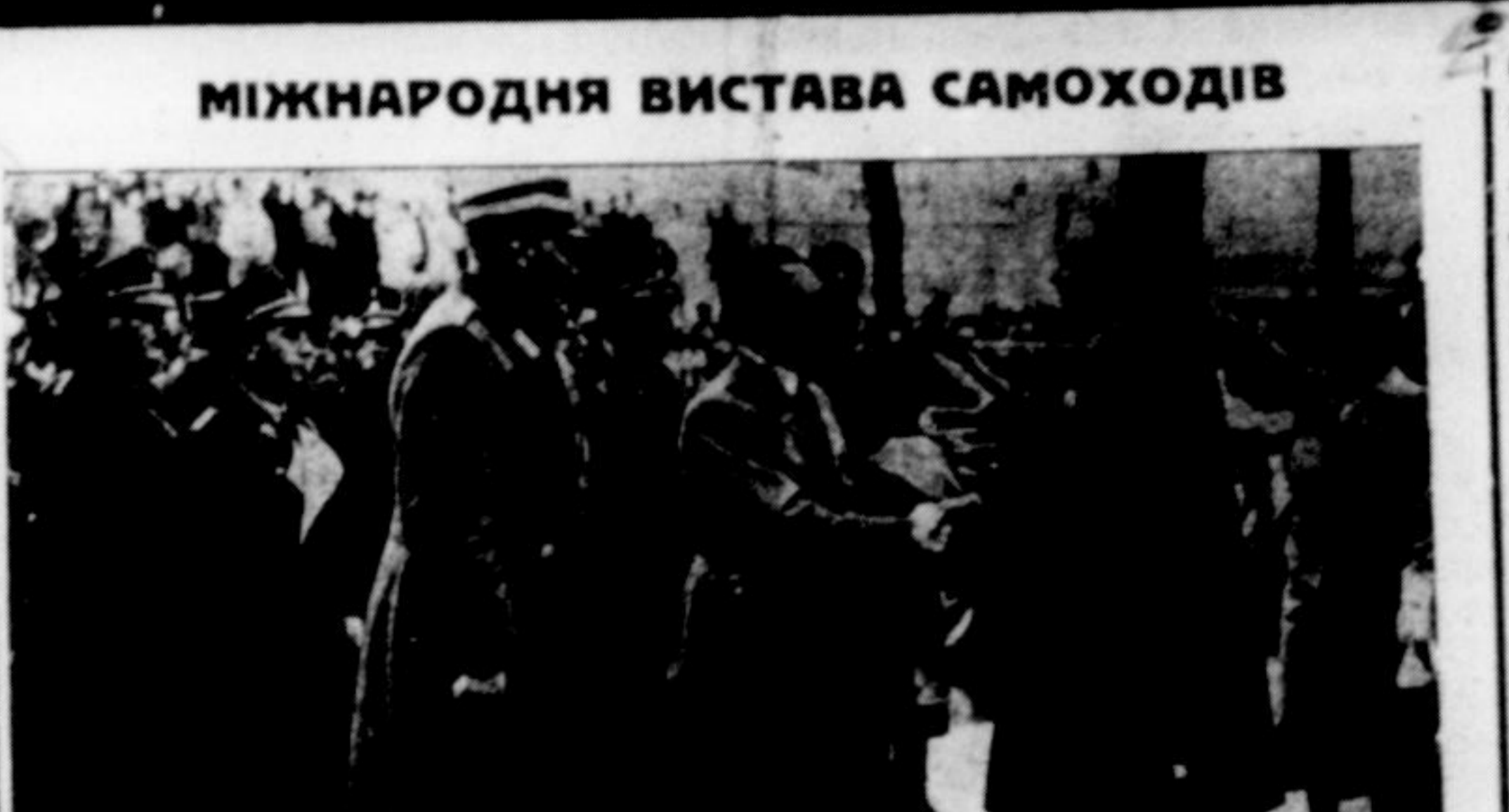
В Берліні отворили врочисто в присутності канцлера Адольфа Гітлера Міжнародну Виставу Самоходів і Моторів.