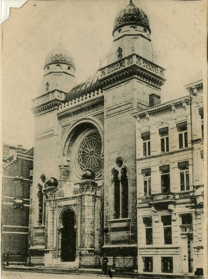
Antvers. La Synagogue.