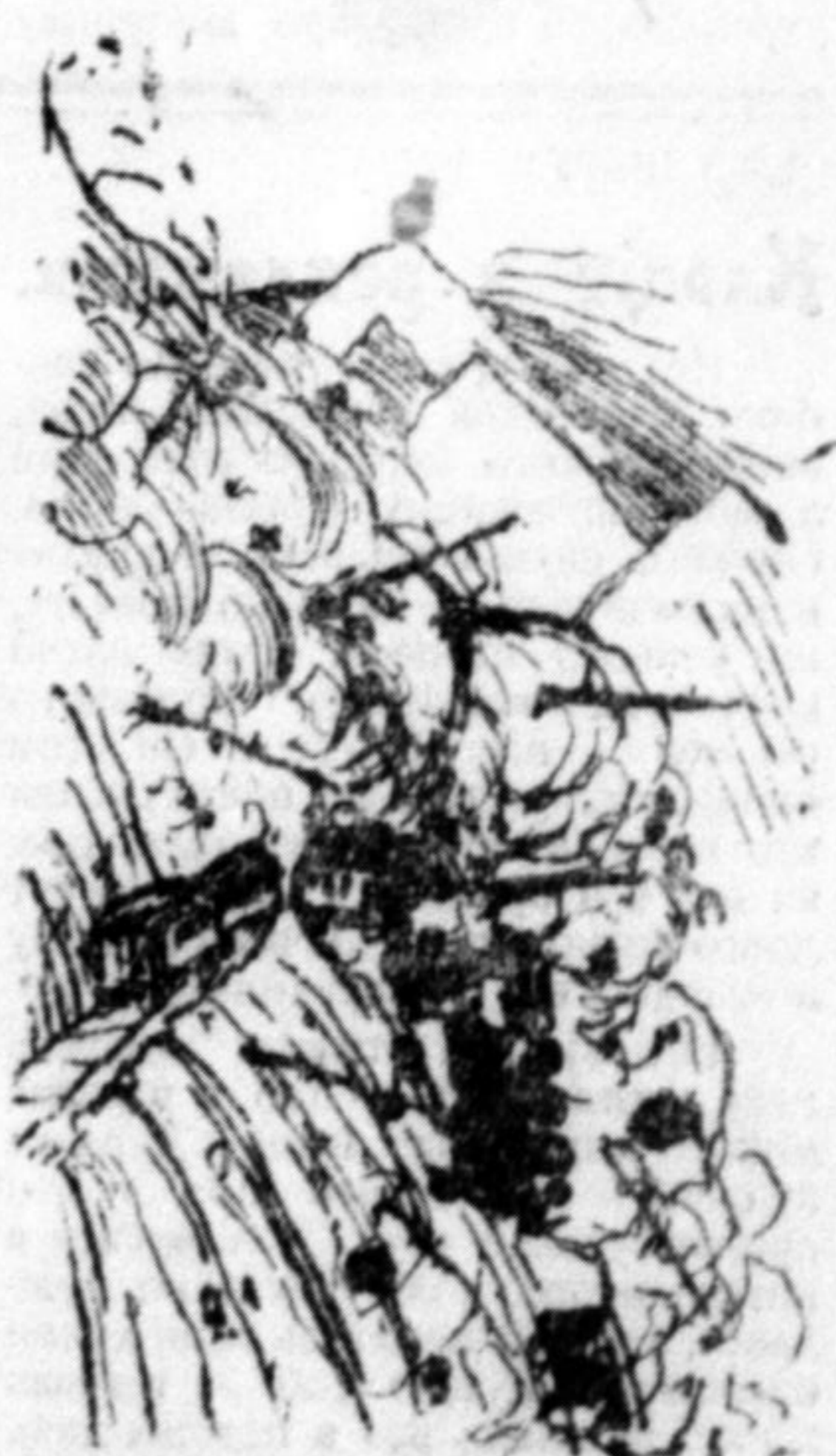
Лявіна величезних розмірів заспала перезджаючий поїзд. Майже всі люди погинули.