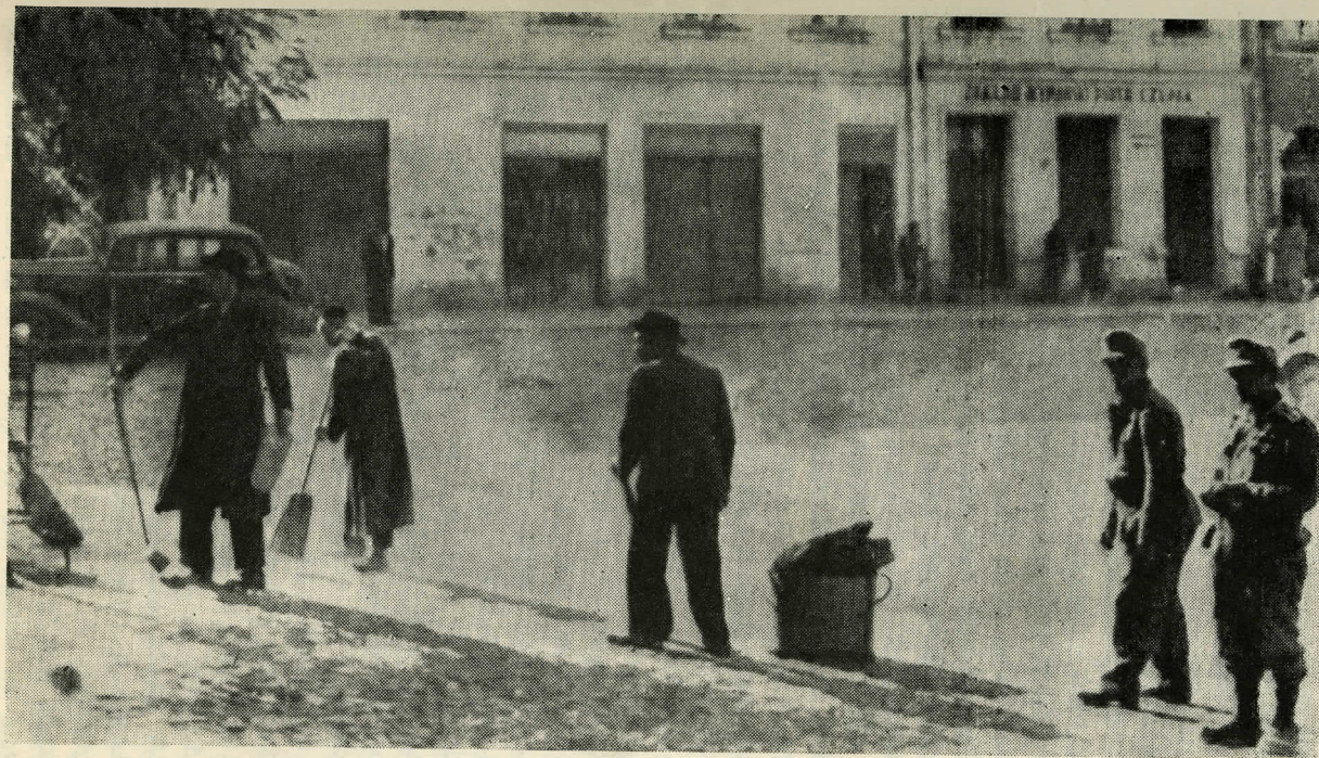
איבערגעגעבן דורך בערמאן.