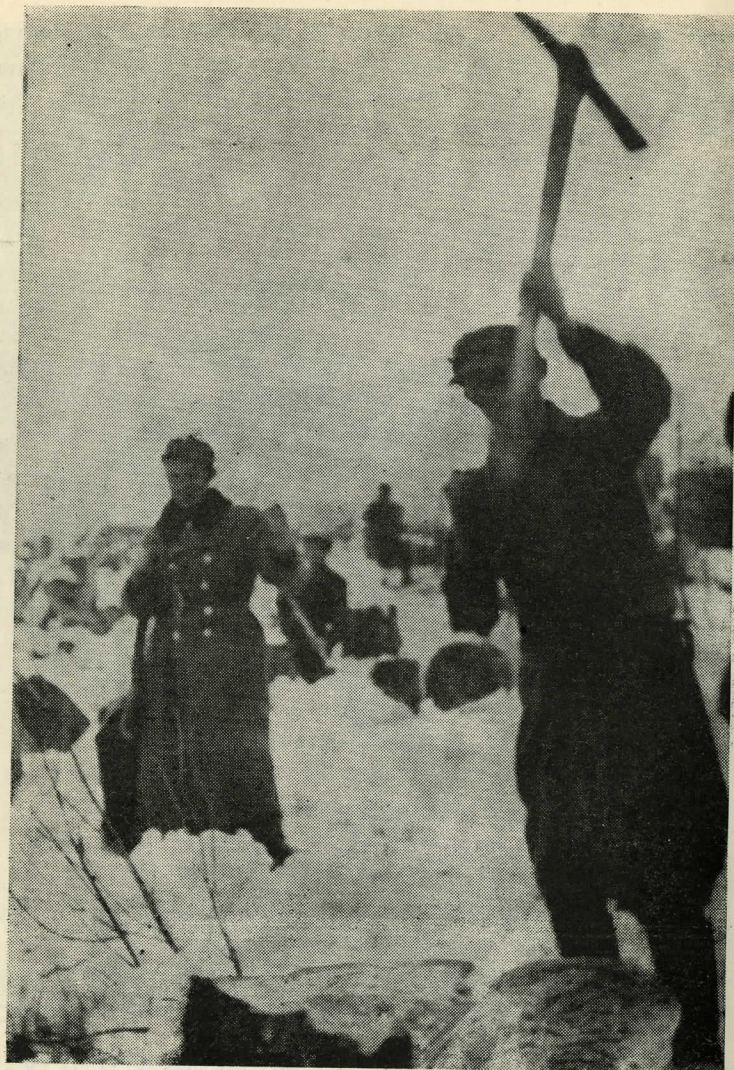
גאליציע. אוקראינישע פאליציסטן צווינגען יידן צו צערשטערן מצבות אויפן יידישן בית-עלמין אין א שטעטל לעבן לעמבערג. איבערגעגעבן דורך י. זעמאן Galicia. Ukrainian police force Jews to destroy monuments on the Jewish cemetery in a small town near Lwow.