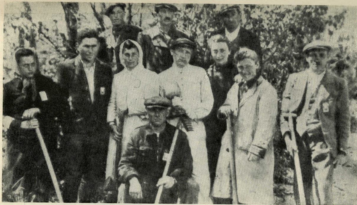
ט א ר נ א פ א ל (גאליציע) יידישע אַרבעטער באַשעפטיקט אויפן בית-עולם אין יאָר 1943. איבערגעגעבן דורך דער היסטאָרישער קאָמיסיע, לייפהיים.

Tarnopol, Galicia, 1943. Jewish workers employed on the cemetery.