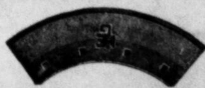
Noże sieczkarniane „MEG”

„Wschód” Spółka maszynowa z ogr. por. w Przemyślu, ul. Mickiewicza 7.