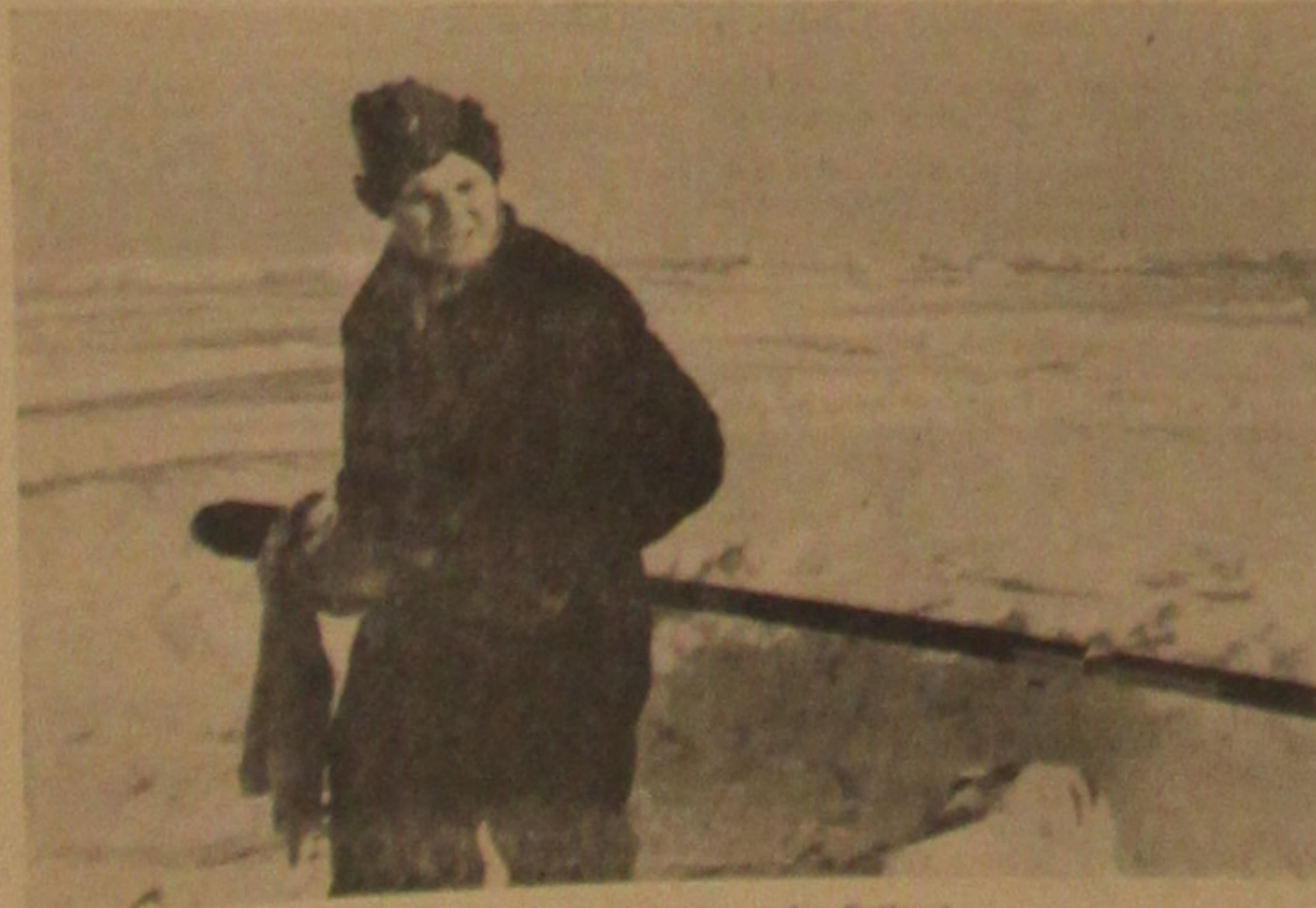
Bei einer Flakbatterie an der Ostfront Reinigen der schweren Geschütze bei Schnee und 20 Grad Kälte