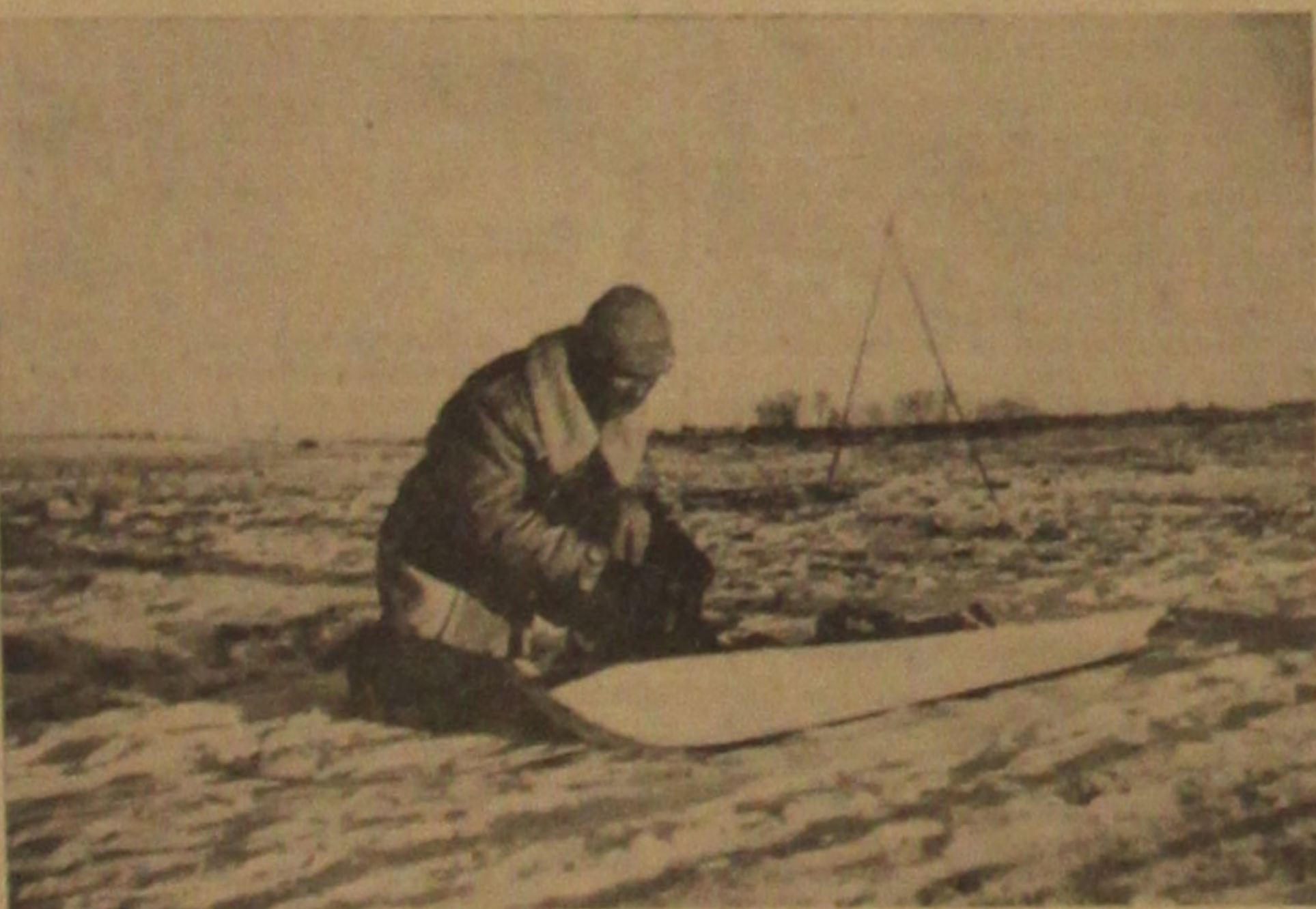
An allen Abschnitten der Ostfront, an denen meterhoher Schnee liegt, helfen sich unsere Soldaten mit dem Waffenkajak, einem Bootschlitten, zum Transport von Verpflegung, Munition und auch Verwundeten auf kurze Entfernungen