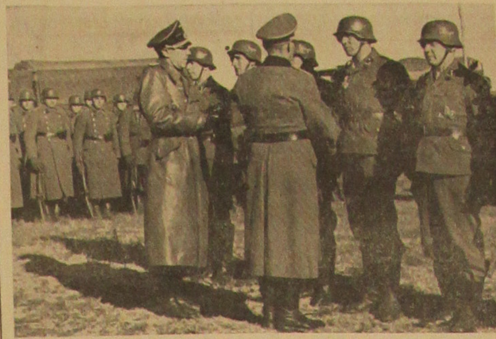
Führer und Männer eines Transportregimentes der „NSKK-Gruppe Luftwaffe“ werden für Tapferkeit vor dem Feind mit dem Eisernen Kreuz ausgezeichnet...

gilt, der Grundsatz der Freiwilligkeit, das gilt insbesondere aber auch für die kulturelle Arbeit der Bewegung. Kultur kann man nur wecken, aber nie erzwingen.