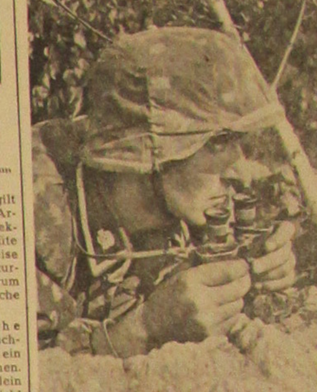
Melde dich sofort freiwillig bei der ff-Ergänzungsstelle Süd (VII), München 27, Pienzenauerstraße 15.