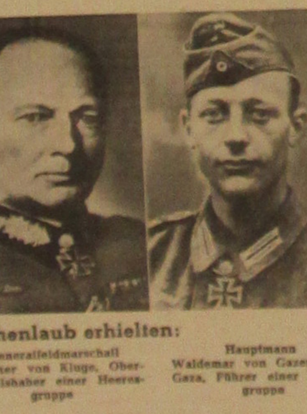
In der Pflege des Gemeinschaftslebens, des Hausmusikwesens und der Dorfmusik, in der heimatkundlichen Arbeit, in der Brauchumpflege, in der Betreuung der Ortsbücherei, des Puppen- und Laienspielwesens...