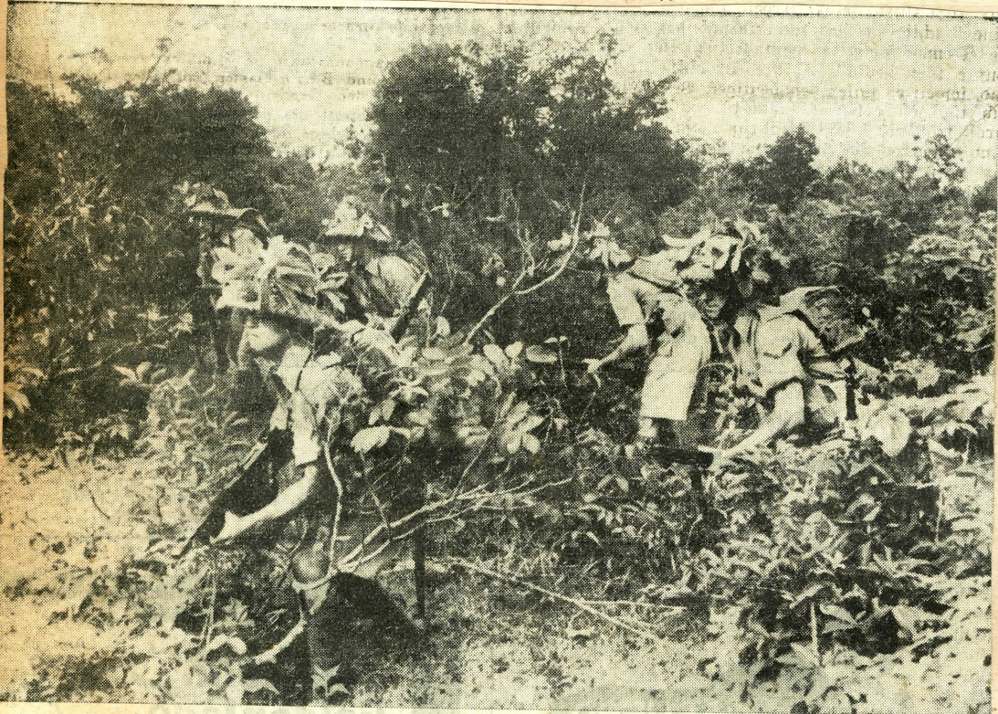
Australische Truppen an der Grenze Nordmalaya-Thailand