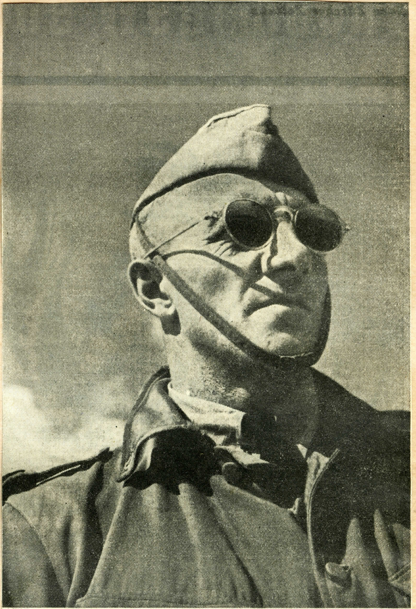
Der Typus des ausdauernden Indo-europäischen Kampfflegers von Niederländisch-Indien