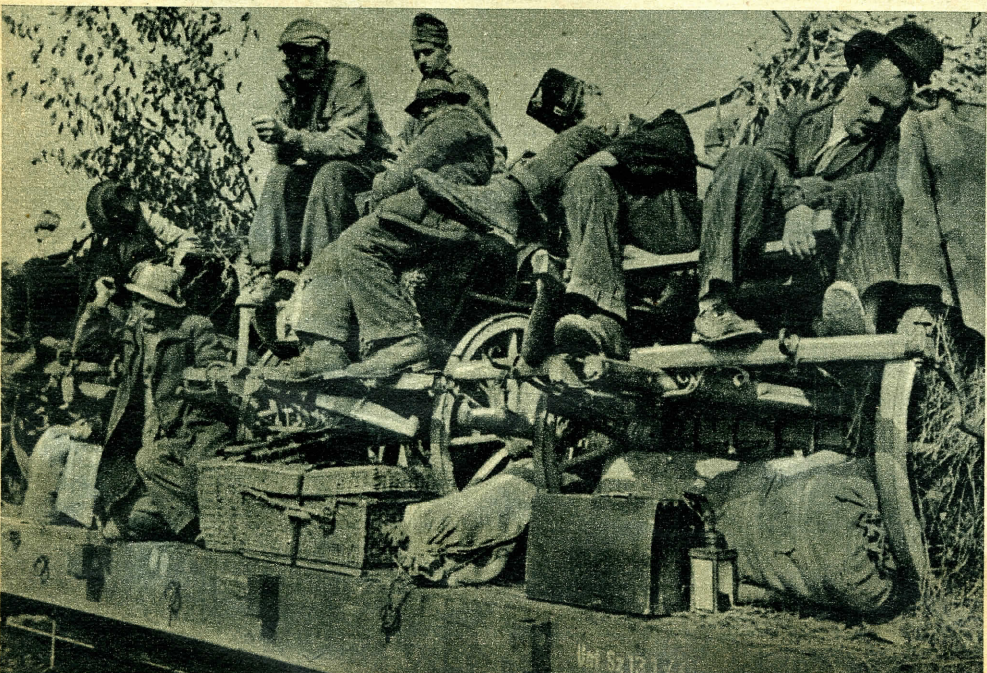
Izgalmas órák közepette is megérkezik az álm.