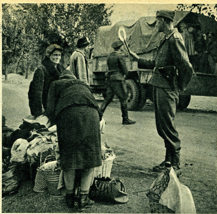
Egyetlen hely sem maradhat üresen egy gépkocsin. Minden talpálatnyi helyet megtöltöttek a menekülők holmijai.