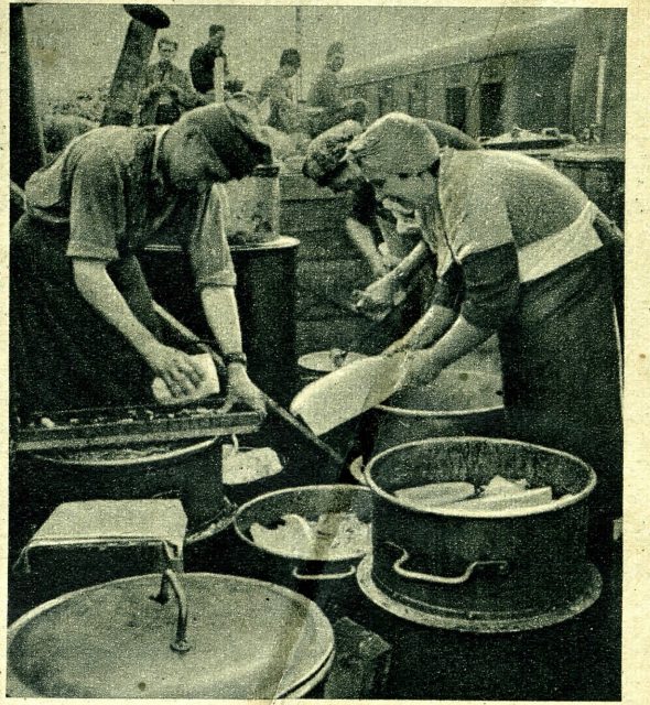
A menekülőket honvédszakácsok és háziasszonyok várják a friss ételekkel.