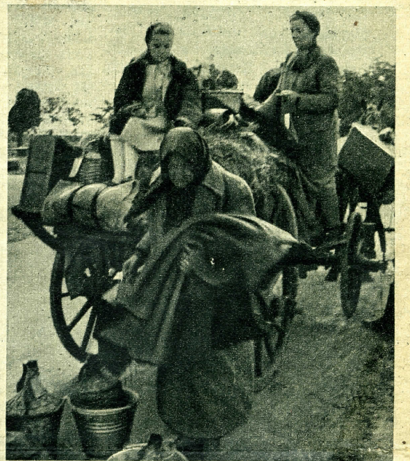
Olykor a kocsi és ló helyettesíti a vasutat.

A menekülők és a kiűritettek azzal a biztos érzéssel hagyhatják el lakhelyüket, hogy távozásuk csak átmeneti és a hadműveletek sikeresebb, hatásosabb alakítása céljából vált szükségessé. A lehető legrövidebb időn belül visszatérhetnek arra a földre, abba a házba, amely övék és amelyet a magyar honvédség német bajtársaival vállalva megóv számukra. Számtalan példa bizonyítja, mit jelent az ellenség pusztító dühe azokon a területeken, amelyeket átmenetileg sikerült hatalmába kerítenie. Magyar élet, magyar vér és magyar érték megmentéséről, átmentéséről van szó, amikor menekültekről és kiűritettekről hallunk. A hadműveleti terület mögött élő lakosság ezzel az érzéssel nézze, fogadja be és támogassa a menekülteket, hogy életükből és munkájukból felépülhessen az, amiért mindannyian dolgozunk és harcolunk: a szebb magyar jövő.