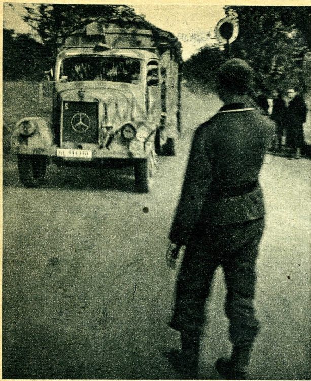
Katonai és polgári gépkocsik egyaránt résztvesznek a kiűrés forgalmában.