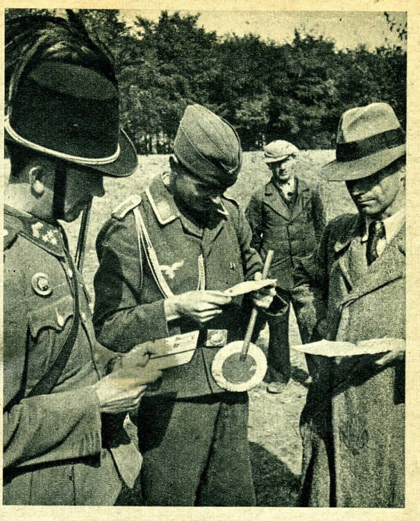
Magyar és német közbiztonsági közegek ügyelnek a rendre. Szigorú igazoltatások akadályozzák a gyanús elemek átszivárgását.