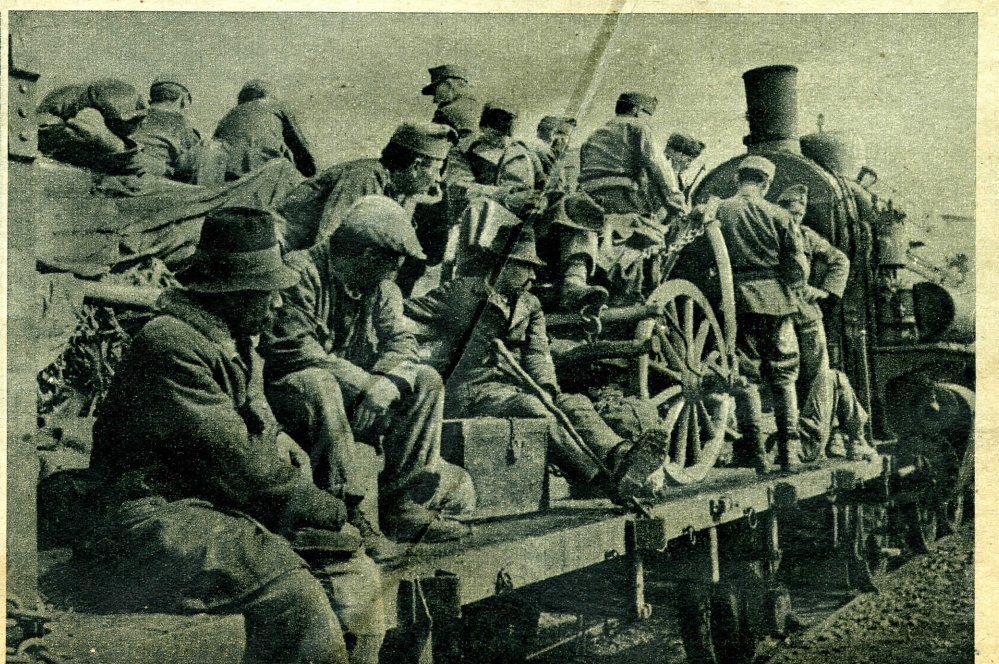
Ahol tud, segít a honvéd! Az egymásután gördülő katonai szerelvénnyel szeretettel segítik a kiűrt területek polgári lakosságát.