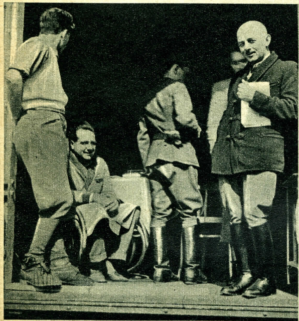
A szükséglakások nem nélkülözik a jókedélyt. Tudják, hogy az otthonok elhagyása csak átmeneti és ideiglenes.