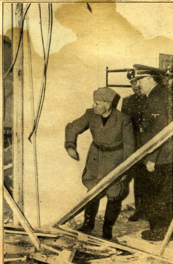
Der Ort des Mordanschlages auf den Führer. Der Führer zeigt dem Duce den Tatort. Die Stelle, an der der Führer am Kartentisch saß, ist durch Kreis und Pfeil gekennzeichnet. Aufnahme: Heinrich Hoffmann (3).