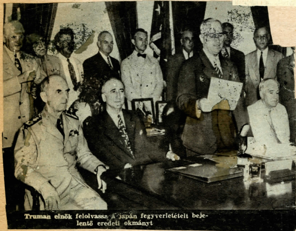
Truman elnök felolvassa a japán fegyverletételt bejelentő eredeti okmányt