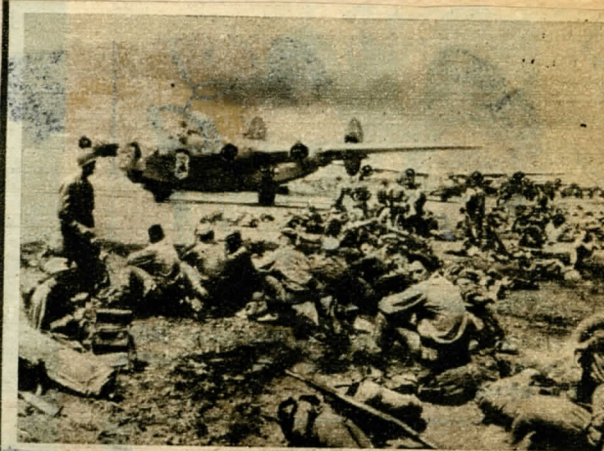
Az első megszálló csapatokat repülőgépen szállították Japánba. Indulás előtti pihenő Okinawan