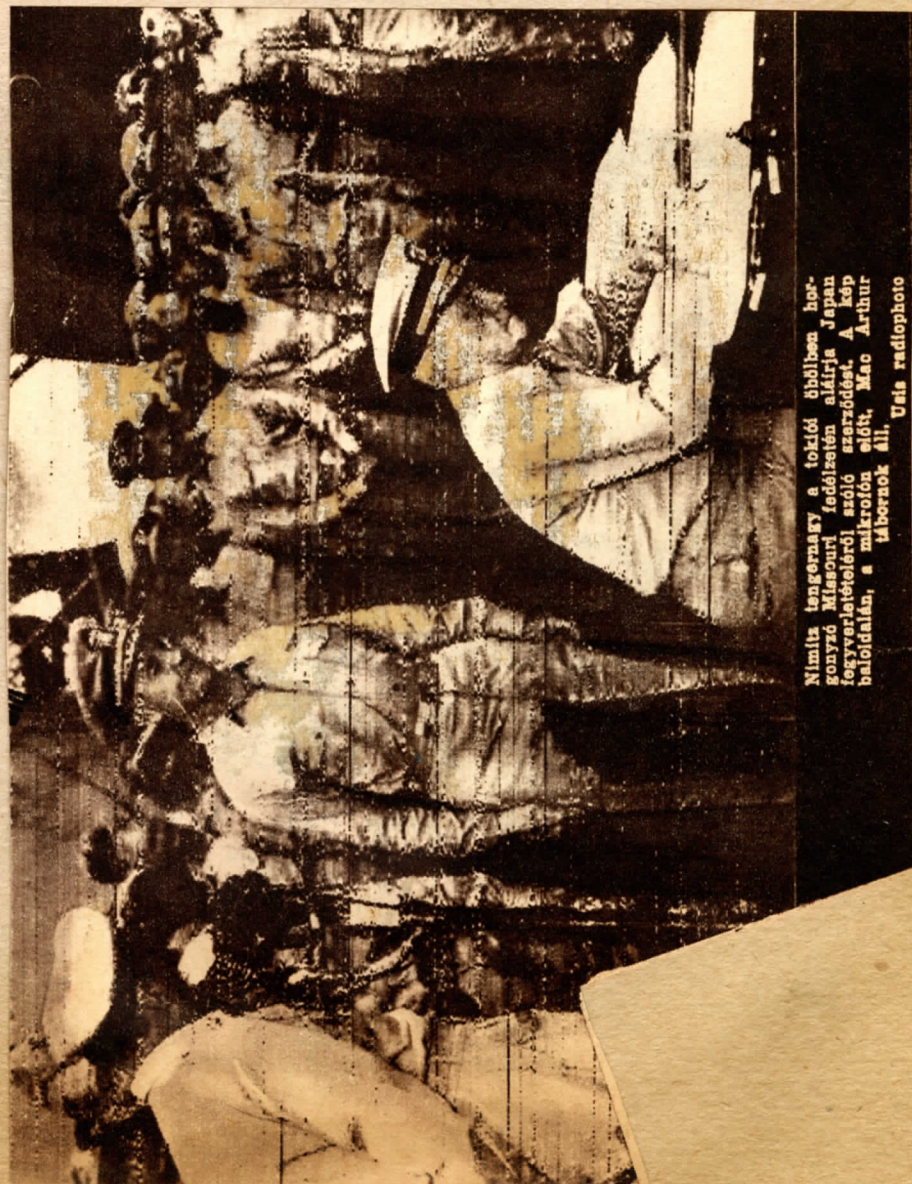
Nimfcs tengernagy a tokiói öbölben beszállító Missouri fedélzetén aláírja a fegyverletételt az első szarvódat. A kép baloldalon, a mikroción előtt, Mac Arthur tábornok áll.