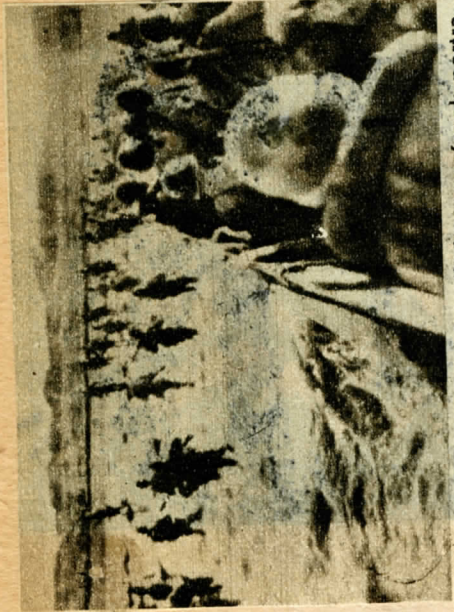
Rádió érkezt kép. Amerikai tengerészek partra szállnak Futszuban. A futtsui földnyelv a tokiói öbölbe nyúlik. Ezen a ponton kezdődött meg a japán szárazföld előzőtlése

Nagaszaki egyharmadát elpusztította a csütörtökön ledobott atombomba — Szovjet repülők súlyos támadása japán kikötők ellen