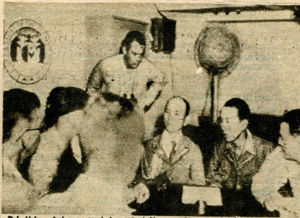
Rádió érkezt kép. A Missouri csatahajó fedélzetén az Egyesült Államok kiküldöttei, William F. Halsey tengernagy és vezérkara a japán fegyverzeteti bizottsággal a fegyverletételt módosztatni tárgyalja meg