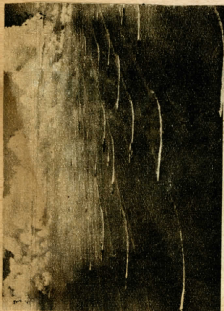
Az amerikai flotta bevonul a tokiói öbölbe tizenkét csatahajó, huszonhárom repülőgépanyahajó, húsz cirkáló, kilencvenegy romboló és többszáz speciális inváziós vízijárművel