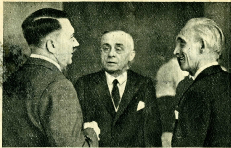
Bárdossy és Sztójay az európai fasiszta politika bandavezérével, Hitler Adolf-fal. Ezen a találkozón vették át Hitler parancsait Magyarország tönkretételére