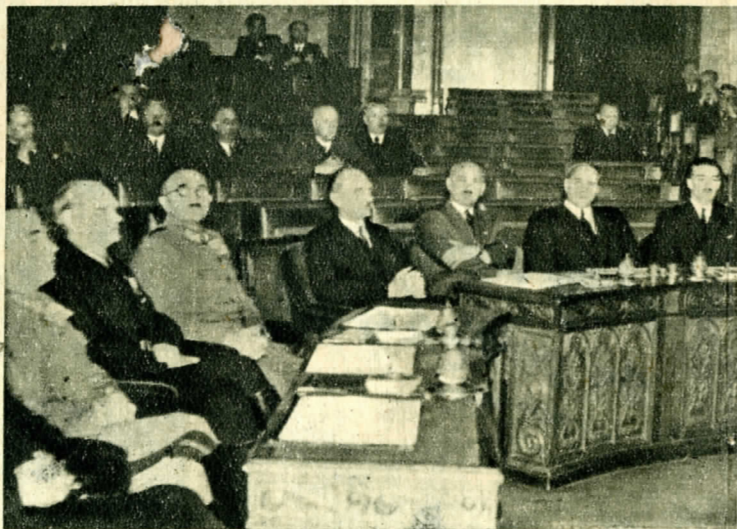
A Szálasi-kormány: balról jobbra: Hellebronth Vilmos, Kovarcz Emil, Beregy-Berger Károly, Jurcsék Béla, Rajniss Ferenc, Szakvári Emil, Reményi-Schneller Lajos, Szöllösi-Nászluhác Jenő, Vajna Gábor. Mögöttük félig üresen tátonganak a magyar nép képviselőitől megfosztott parlamenti padsorai