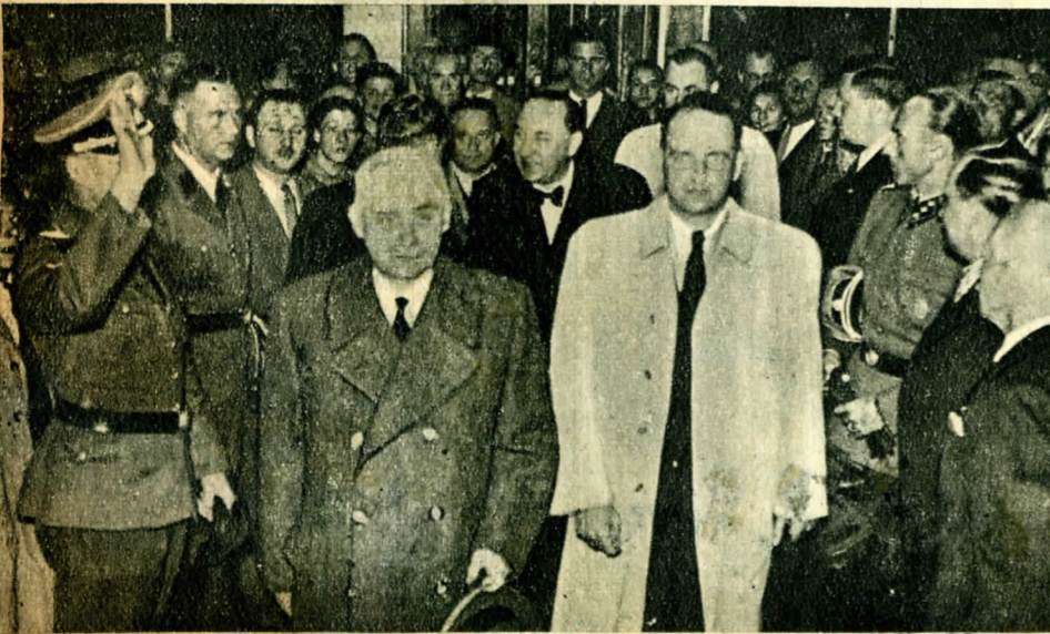
Sztójay Döme 1944 májusában, mint a németek által kinevezett „magyar miniszterelnök”. Mellette közvetlen felettese, Veessenmayer német meghatalmazott