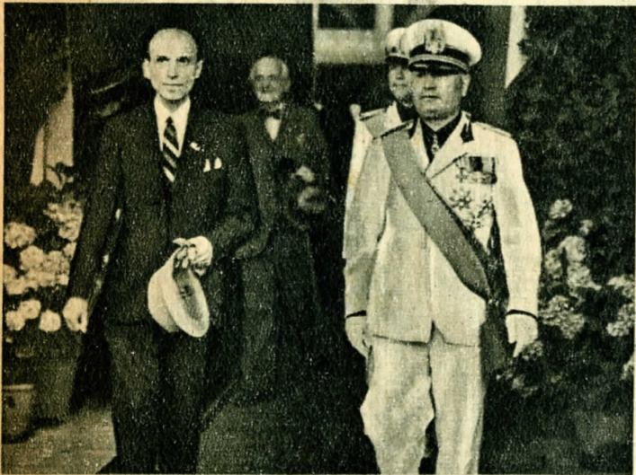
Imrédy Mussolinival is barátkozott