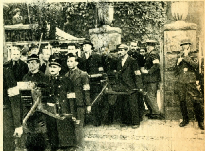
1944 október 15. A német katonák árnyékában gépfegyvereket hoznak ki egy titkos fegyverraktárból a nyilas puccsban résztvevők