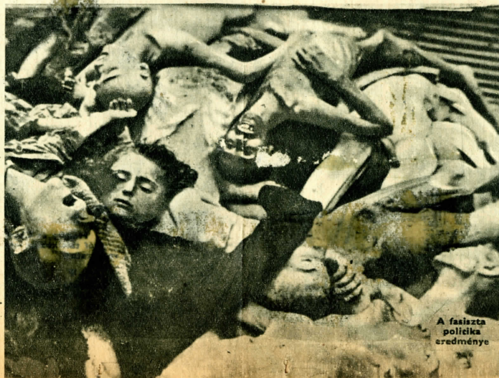
A fasiszta politika eredménye