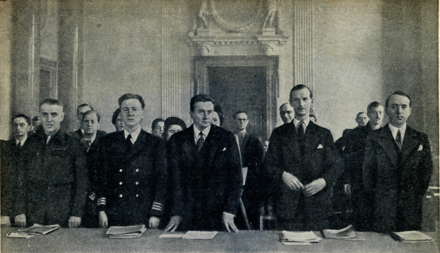
Первое заседание Международного Военного Трибунала по делу главных немецких военных преступников. На этом заседании, состоявшемся 18 октября в Берлине, главные обвинители от СССР, США, Великобритании и Франции вручили Трибуналу тексты (на четырёх языках) обвинительного заключения.