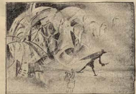
W. Drabik. Projekt dekoracji do „Don Kiszota”.

owa wizyjność, tak charakterystyczna dla twórczości Drabika. Miał się w nich bezinteresowność artysty, który musiał się wypowiedzieć, bez względu na to, czy projekt jego ma szansę realizacji, czy też nie. Był to bowiem człowiek bez reszty oddany