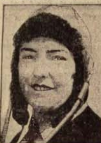
Zwycięzcy w locie na 750 mil.