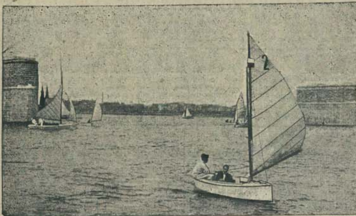
Zdjęcie na pycie kraj. „Alfa”.