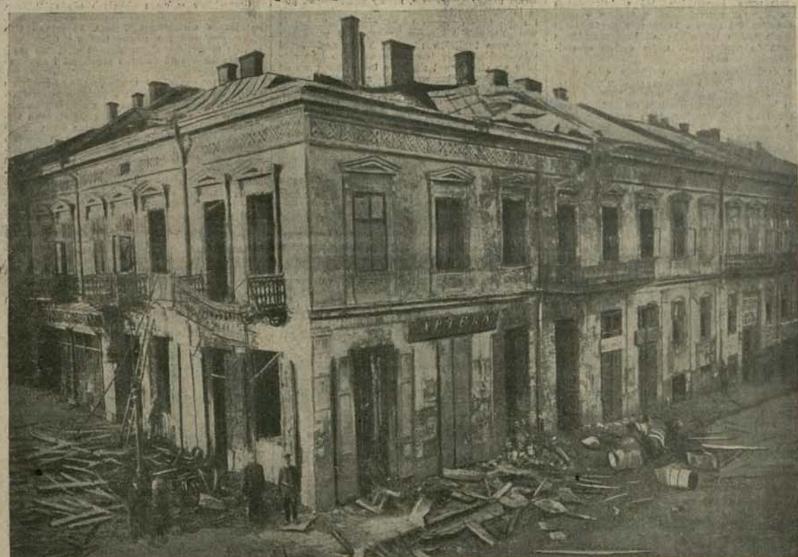
W Drohobyczu na dwupiętrowej kamienicy przy ul. Stryjskiej L. 2, wydarzyła się straszna w swych skutkach eksplozja benzyny, którą spowodował nieostrożnie porzucony niedopalak papierosa. — Fotografja naszego przedstawiciela zupełnie zdemolowaną aptekę Tobiaszka i skład benzyny Löwenberga, gdzie nastąpiła eksplozja. W katastrofie zginęło sześć osób, a kilkanaście zostało ciężko rannych.