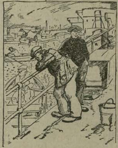
— Ty, Włóki! Kłbisko bez roboty! — Głupsi Ferdaki! Z robotą jeszcze gorzej.

SŁUŻACA do wszystkich zaraz poszukiwana. Sieni-rodzkiego II, 1 za prawo. 6938g