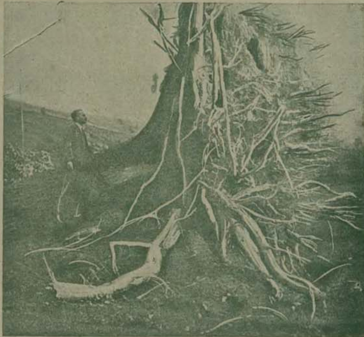
(Kr.). Dnia 26 b. m. wleczorem nawiedziła część pow. sanockiego i liskiego trąba powietrzna. Próca olbrzymich szkód to: zwałowiska drzewostanów i zbiorach, katastrofa szpitalona pociągła za sobą ofiary w ludziach: jedna osoba jest zabita, dwie ciężko ranna. — O potęgę niszczytelnej huraganu daje wyobrażenie powyższa reprodukcja zdjęcia, dokonane na miejscu katastrofy. — Jest to olbrzymia topola o średnicy pnia 1 1/2 m., wyrwana przez burzę z korzeniem. Korona tego drzewa zatrasowała pobliskie tor kolejowy.

Dość w piątek dnia 3-go k. m. niezawalnia poster estak 2 dramaty: I. O JEDNA KOBIEcie 846k II. PRZED ŚLUBEM MILCZEĆ z Betty Lompsen i Głorją Swanson w roll gł.