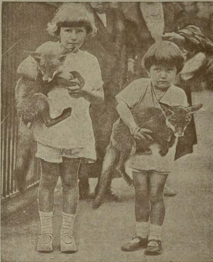
(—). Piękny, zoologiczny ogród w Londynie w Regent Park, stanowi najmlodszy punkt zborny dla dlatywy z całej stolicy Anglii. Dzieci z zachwytem obserwują zwierzęta, karmią je, a miłośnicy zwierząt mogą się bawić z nimi. I tak n. p. na rycinie naszej widzimy dwie, małe dziewczynki, trzymające na rękach młode, łagodne lisy.

ZAKŁAD fryzjerski w ho-telu Europejskim — przy-jmie zaraz poszukiwa ni-ego-dumskiego i ondulac-je manucurystkę. 6607g