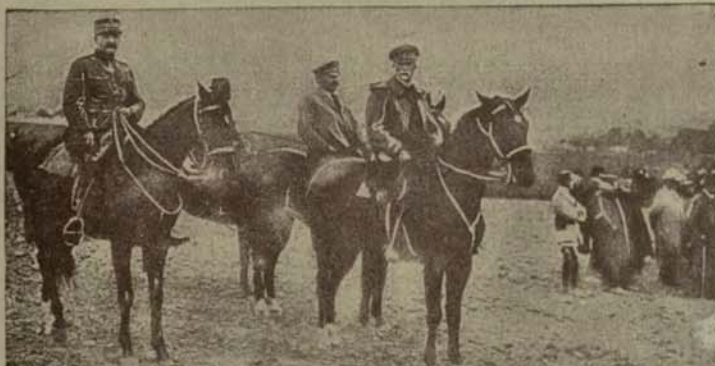
W tych dniach rozpoczęły się w Czechach w obecności prezydenta republiki Masaryka jesienne manewry armji. — Na ilustracji naszej widzimy prez. Masaryka (x), gdy na koniu przypatruje się akcji wojska.