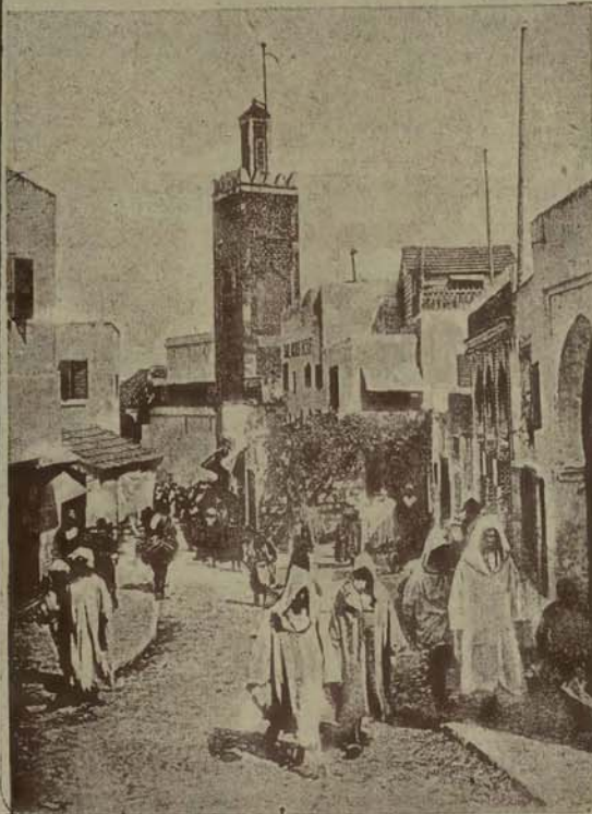
Hiszpani, nastąpiło na życzenie Angli, która posiada w Gibraltarze „klucz” do morza Śródziemnego, do Suezu i do Indyi — i nie chce żadną miarą pozwolić Hiszpani usadowić się naprzeciw Gibraltaru.

Hiszpania w przeddzień zebrania Ligi Narodów, (w której domaga się stalego miejsca), uznała za wskazane wystąpić z żądaniem, aby Tanger wcielony został w sferę wpływów hiszpańskich. Czytelnicy wiedzą z telegramów o silnem wrażeniu w sferach dyplomatycznych na skutek tego żądania Hiszpani, przeciw któremu Anglia już założyła veto. Sprawa marokańska powiększa trudności konferencji genezyjskiej i jest przedmiotem dyplomatycznych targów. Ilustracja nasza przedstawia życie uliczne w Tangerze.