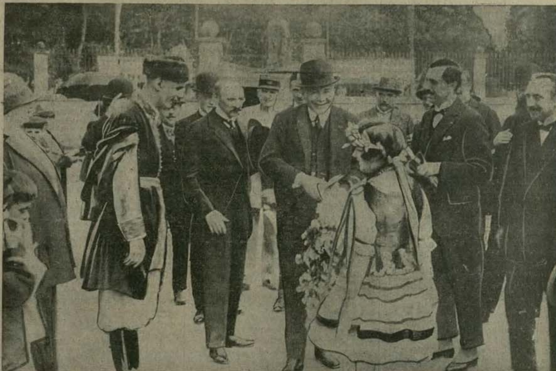
Jak już pisaliśmy przed kilku dniami, w Caen we Francji urządzono pierwszą międzynarodową wystawę dzieł sztuki. Uroczystość otwarcia tej wystawy rozpoczęła się od zwiedzenia sekcji polskiej i zamienia się w manifestację franko-polską, na której przedstawiciele m. Caen i komitetu organizacyjnego, w obecności przedstawicieli polskiej ambasady w Paryżu, dali wyraz przyjaźni polsko-francuskiej. Na wystawie tej zorganizowano następnie „dzień polski”. Była to manifestacja muzyki, śpiewu i tańca, rozłożona na poranek i wieczór. Za to wybrano wspaniałą fuzję blisko tysięcznego opactwa, a za salę koncertową służył przed gmachem, gdzie ustawiono estradę. „Dzień polski” w Caen był manifestacją franko-polską na wielką skalę i spełnił w zupełności swe zadanie propagandowe. — Ilustracja nasza przedstawia moment, gdy jedna z polskich dziewczynów w ręce wianek kwiatów przybyłemu na uroczystość ambasadorowi polskiemu w Paryżu, p. Chłapowskiemu.