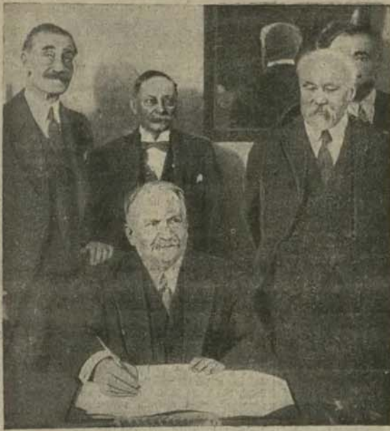
Pałac dziennikarski w Paryżu.

Rok XVII. Kraków, niedziela 28 listopada 1926. Nr. 327.