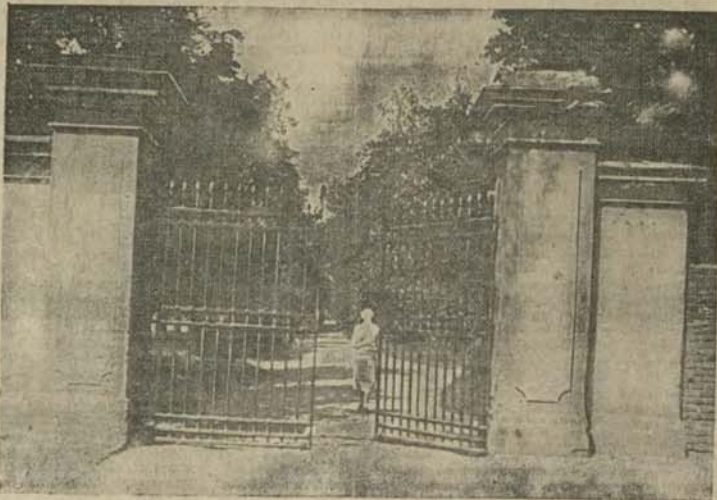
Brama Zielona parku Łazienkowskiego, przez którą b. prezydent Rząpltej, St. Wojciechowski, wraz z orszakami opuszczał Belvedere na parę chwil przed zajęciami przez oddziały Marszałka Pruskiego.