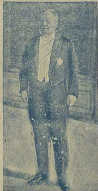
Marszałek Senatu Wojciech Trąpczyński wyjechał do Poznania celem przeprowadzenia akcji, mającej na celu uspokojenie podnieconych zamachem umysłowo ludności wielkopolskiej.