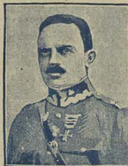
Gen. Włodzisław Zagórski, b. szef lotnictwa, kierował obcą lotniczą po stronie rządu. Część prasy warszawskiej zarzuca mu, że gen. Zagórski do ostatnich chwil bombardował osobiście wojska Marsz. Piłsudskiego, skutkiem czego zniszczył wiele domów i spowodował ofiary wśród ludności cywilnej.

skiego idą naprzód. Godzina 5:20 popołudniu — Belweder wzięty. Tank „Stas” sforsował barykadę w Alejach Ujazdowskich. O szóstej dosłownie cała Warszawa rusza w Aleje. Po jezdni walają się poprzetrwane lawki. Wszystkie lampy porożbijane. Druły tramwajowe przerwane. W parku stanowiska wojsk rządowych znaczą odcypy i trupy. Cała jezdnia usiana gałkami poobcinalnymi przez kule. Wśród tego zniszczenia powiewają majestatycznie sztandary polewstw zagranicznych. W Alei Róe łopocze się flaga gwiazdista Stanów Zjednoczonych, zdając się mówić: „Moście się bić pomiędzy sobą, ale biada wam, jeżeli ten sztandar zwiniecie!” Na ulicy Koszykowej granat zdemolował kryty balkon w domu Nr. 39 i zabił trzy kobiety. Leżą w bramie. Na chodniku siewe włosy i rozpryskięty mózg. Podjeżdża trupa. Z kraków miasta słychać kanonadę armatnią. Mijam kościół. Nabożeństwo majowe akrobiczne. Ksiądz intonuje: „Z dymem pożarów, z kurzem krwi bratniej, Do Ciebie, Panie, bije ten głos, Skarga to straszna...” Tum podchwytuje słowa, które miesza się ze szpatynowym szlochem i potężnym akompaniamentem organów. W oddali grają armaty. Jan Lankou.