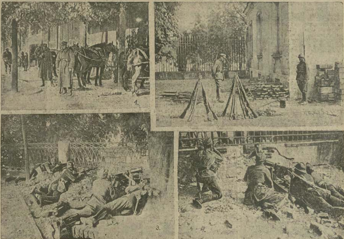
1) Postój artylerji kownej w Alejach Jerozolimskich; 2) Na dziedzińcu Belwederu, pod ścianą broń poległych obrońców; 3) Wojska rządowe ostrzelują z tarasu Belwederu wojska Marsz. Piłsudskiego; 4) Karabiny maszynowe wojsk rządowych w Alejach.