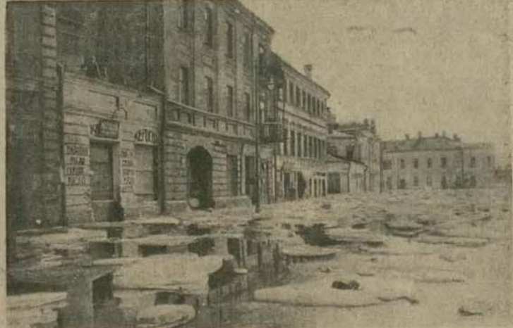
Jak donosiłiśmy, Moskwę nawiedziła strasna w skutkach powódź. Rzeka Moskwa wystąpiła z brzo- gów i zalala nadbrzeżne ulice, przyczem kva lodowa, uderzając o ściany domów, szereg z nich po- ważnie uszkodziła.