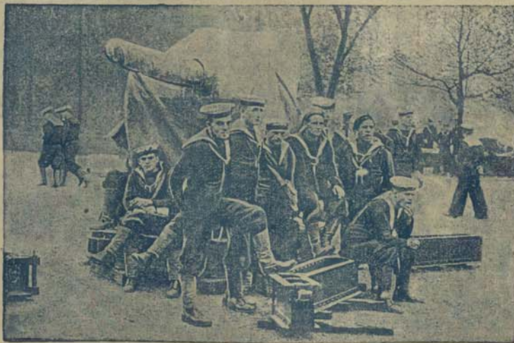
Angielcy marynarze w pogotowie.

Jeden z wybitnych przemysłowców brytyjskich oświadczył, co następuje: Jeżeli — powiedział — walka będzie prowadzona aż do ostatecznych granic, to Anglia wyjdzie z niej uboższa o jakieś 80 miliardów franków. Jest to prawie cena zwycięskiej wojny, albowiem nie można dokładać obciążać całości szkod, wywołanych przez strajk powszechny, takich szkód, jak naprzykład strata różnych rynków zbytu, czuła poszczególne przedsiębiorstw, opartych o mniej solidne fundamenty, a zwłaszcza cofnięcie się produkcji masowej i tak trudne warunki istnienia ze względu na konkurencję światową. Strajk powszechny odbije się ujemnie na skutkach jeszcze w dalszej przyszłości.