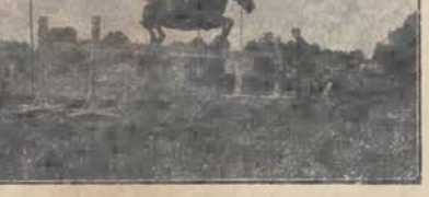
P. Krzeczunowicz na „Orient-Ex” bierze ostatnią przeszkodę w konkursie wycieczajnym na torze 14 p. ulanów Jaszowieckich.