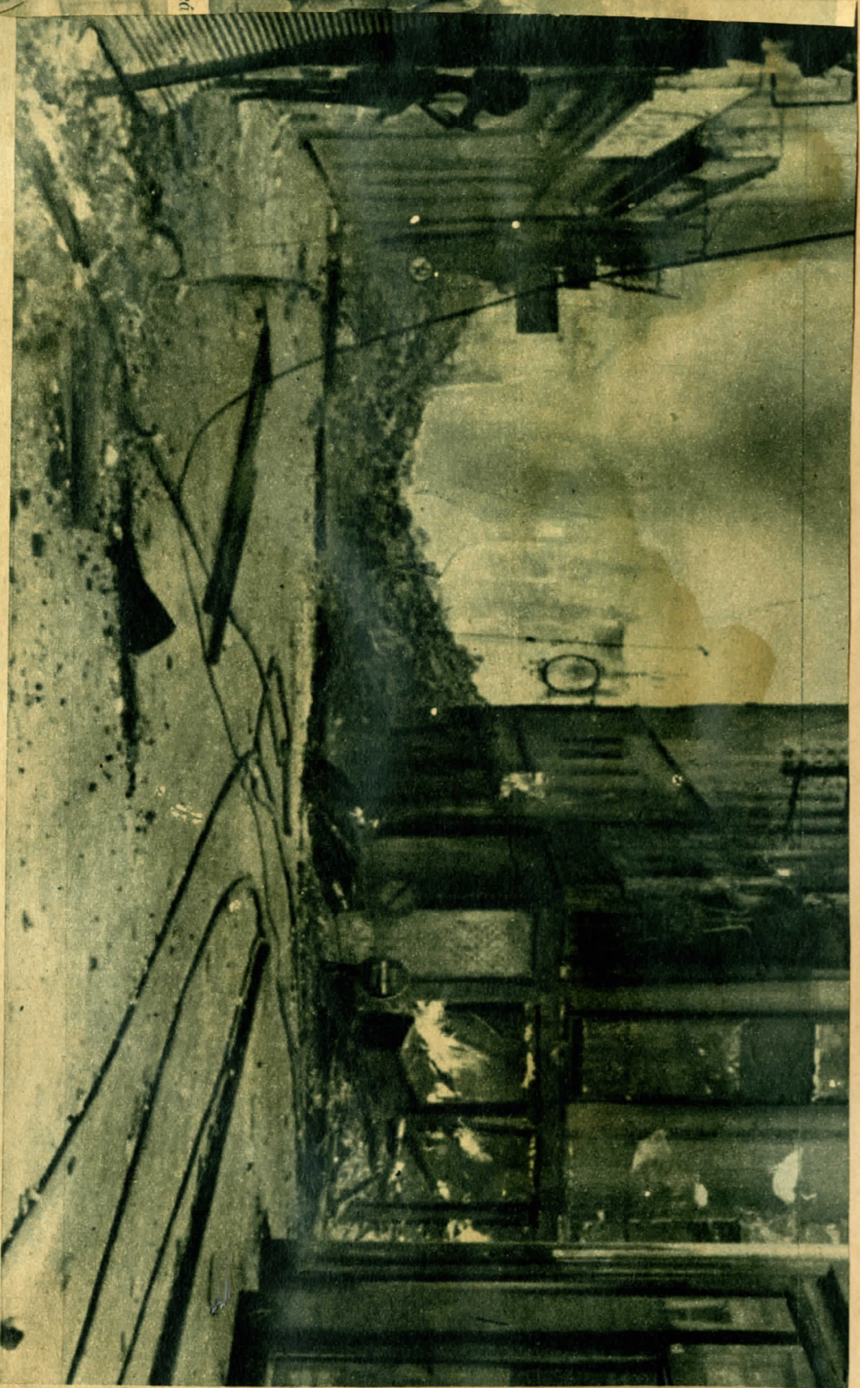
mult kéten is, ebben a szándék is látható az olvasó néhány képet Caenről. Nos, vesszünk egy pillantást a képre: ez ma Caen...