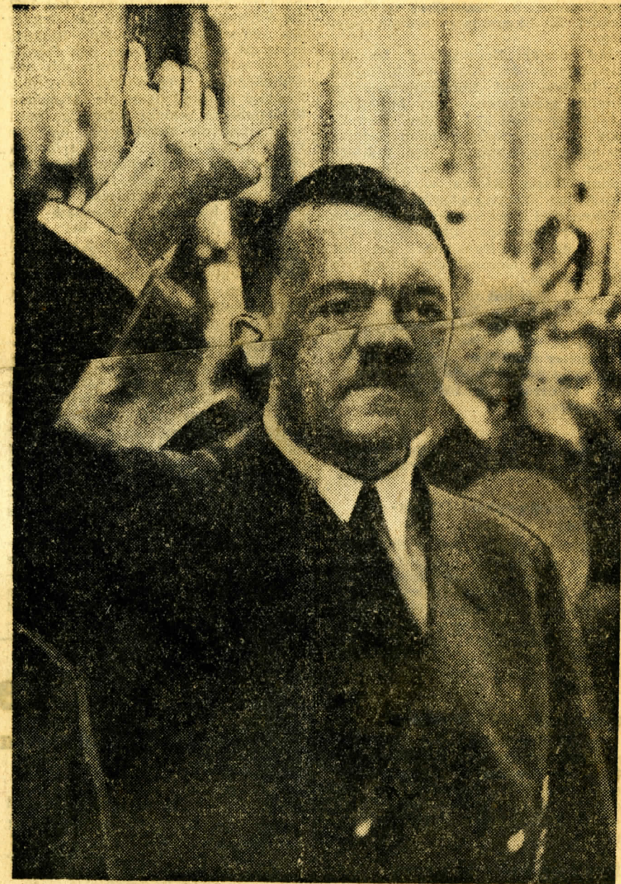
Erbitterte Kämpfe im Osten

hat, hat in feiger Treulosigkeit diesen Mord angezettelt, gemeinsten Verrat an dem Führer und dem deutschen Volke begangen. Denn diese Schurken sind nur die Handlanger unserer Feinde, denen sie in charakterloser, feiger und falscher Klugheit dienen. In Wirklichkeit ist ihre Dummheit grenzenlos. Sie glauben durch die Beseitigung des Führers uns von unserem harten, aber unabänderlichen Schicksalskampf befreien zu können — und sehen in ihrer verblendeten angstvollen Borniertheit nicht, daß sie durch ihre verbrecherische Tat uns in entsetzliches Chaos führen und uns wehrlos unseren Feinden ausliefern würden. Ausrottung unseres Volkes, Versklavung unserer Männer, Hunger und namenloses Elend würden die Folge sein. Eine unsagbare Unglückszeit würde unser Volk erleben, unendlich viel grausamer und schwerer als auch die härteste Zeit sein kann, die uns unser jetziger Kampf zu bringen vermag. Wir werden diesen Verrätern das Handwerk legen. Die Kriegsmarine steht, getreu ihrem End, in bewährter Treue zum Führer, bedingungslos in ihrer Einsatz- und Kampfesbereitschaft. Sie nimmt nur von mir, dem Oberbefehlshaber der Kriegsmarine und ihren eigenen Offizieren, die sie an diesen Verbrechen beteiligen, stellen sich außerhalb ihres Volkes auf. Die Wehrmacht