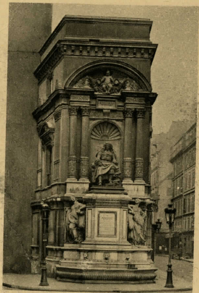
6. PARIS. La Fontaine Molière.