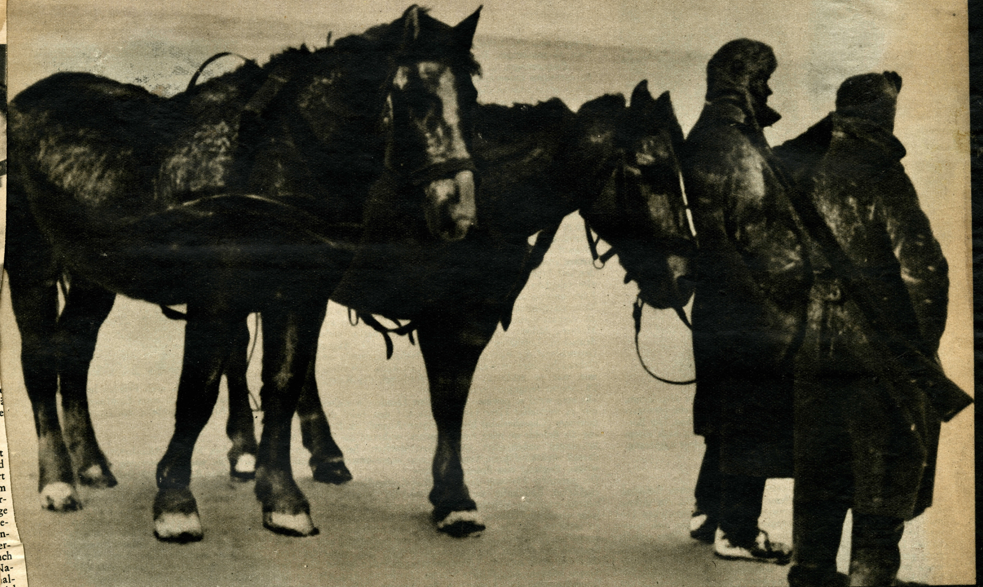
Die neuesten Bilder von den Kämpfen an der Ostfront

Die mit unerhörter Härte geführten Kämpfe auf dem östlichen Kriegsschauplatz stellen jeden einzelnen Soldaten auf eine kaum vorstellbare physische und moralische Widerstandsprobe. Trotz der beissenden Kälte und den in den unendlichen Weiten der russischen Steppe wütenden Schneestürmen muss er durchhalten, auch wenn die Strapazen ungeheure Anforderungen an seine Körper- und Nervenkraft stellen. Diese Aufnahme gibt so recht die Stimmung wieder, welche schwer auf der Seele des Ostfrontkämpfers lastet. Treue Helfer sind ihm die anspruchslosen und ausdauernden Panjepferde. Ueber die strategische Situation in Russland orientiert unsere Karte auf der letzten Seite dieser Ausgabe.