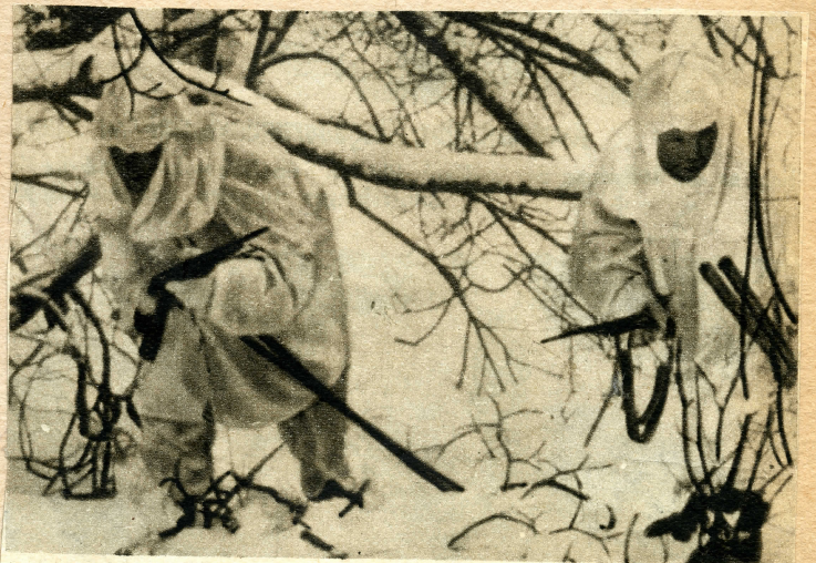
Russische Skitruppen der Fernostarmee auf Patrouille.

Aus den Berichten im italienischen «Tempo» im vorigen Herbst ging hervor, dass es im Kleinkrieg besonders geschulte Equipen gibt, für die ein eigens eingerichteter Nachschub funktioniert, die die Aufgabe haben, bei Truppenverschiebungen an den Ueberlandstrassen, Sammelstellen aufzutreten und im Feuerüberfall mit solch wirkungsvoller Waffe anzugreifen.