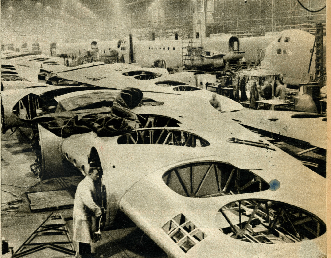
Das laufende Band beherrscht die Kriegsmaterialproduktion. In der Ford-Fabrik in Willow Run soll bald jede Stunde ein schwerer Bomber das Werk verlassen. Amerika ist Europa in den modernen Produktionsmethoden auf dem Kontinent überlegen und nur Deutschland steht annähernd auf der gleichen Stufe. Wer wird den Produktionswettbewerb gewinnen?

Berechnung inkl. europ. Russland und Japan, aber ohne andere Gebietsveränderungen und ohne Berücksichtigung der Neutralen.