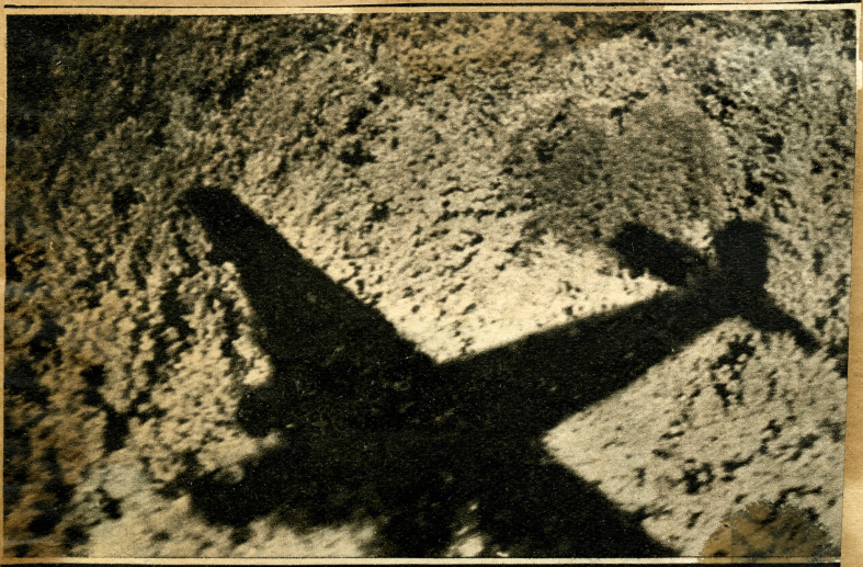
Wie ein Geisterschatten spiegelt sich die Silhouette des Flugzeuges, das unseren Berichterstatter an die Kaukasusfront brachte, auf den endlosen Wäldern des Dongebietes wider.