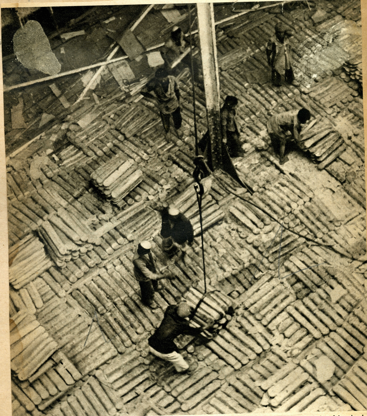
Die moderne Armee braucht unvorstellbare Mengen an Munition. Schiff um Schiff, mit Blei beladen, fährt durch d Golf, um den wichtigen Rohstoff den Russen zuzuführen, die ihn dann selber verarbeiten. In Bender Shahpur werd umgeladen und per Bahn weiterspedit. Hier sehen wir, wie die Bleibarren verladen werden.