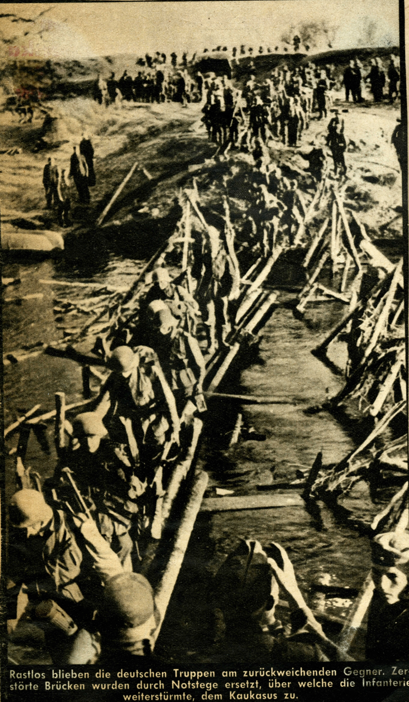
Rastlos blieben die deutschen Truppen am zurückweichenden Gegner. Zer störte Brücken wurden durch Notstege ersetzt, über welche die Infanterie weiterstürmte, dem Kaukasus zu.