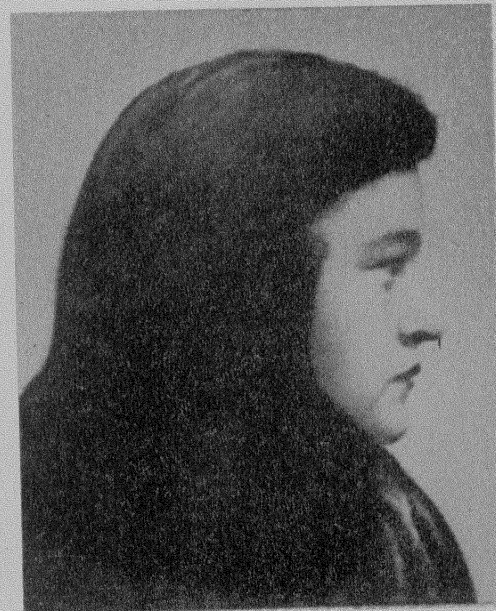
ILSE KOCH, la chienne de Buchenwald.