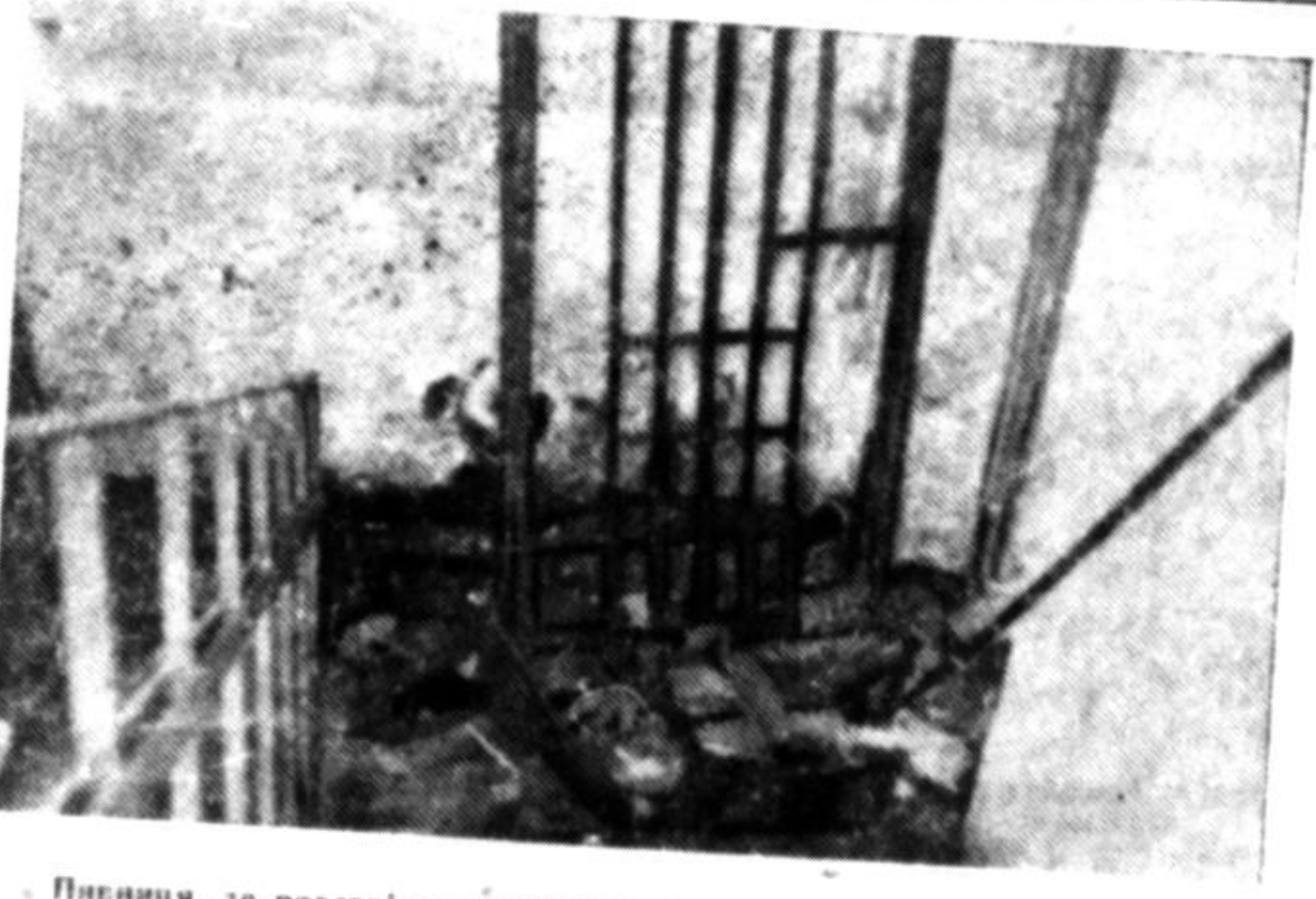
. Пнениця, де розстрізювало НКВД в'язнів. На стінах сліди крови.

ні особи опускають площу. Біля вівтаря відділ новосформованої української міліції. Військові мундури, шапки-мазепинки, кріси на плечах, попереду хорунжий з прапором. Різкий приказ і відділ рушає. Вздовж вулиць публика вітає "наших хлопців" оплесками. Стрічиі мадярські жозніри та офіцери віддають почесть прапорові. Я з трудом пропихаюсь крізь масу людей. Прапор віддалюється та майорить на вітрі, який заносить до мене звуки маршу: "О, Україно, о любя ненько".