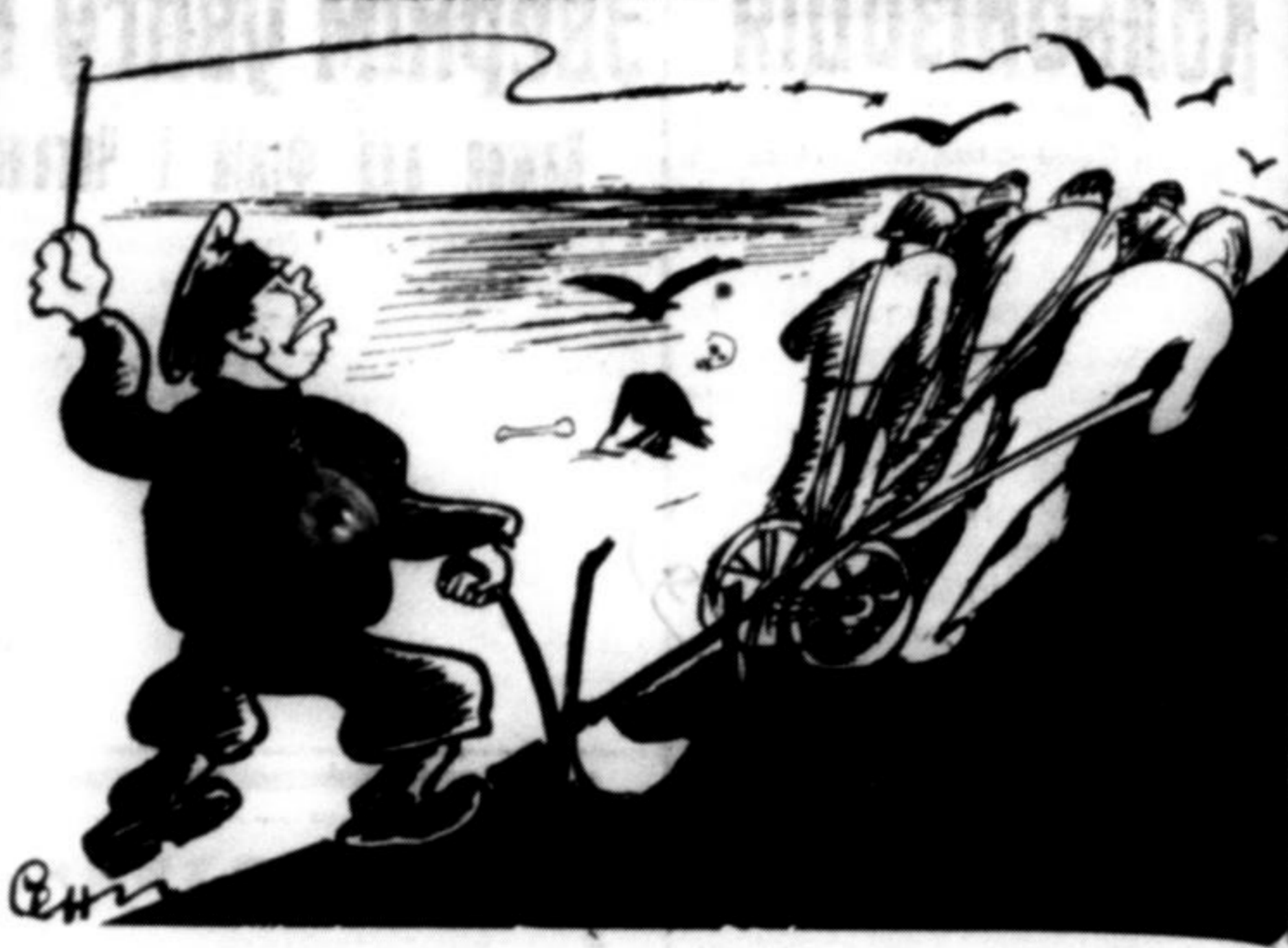
Чекіст: От, кляті хахлі! Трактори попусвали, коней поїли, ще і самі хотять тягнути.

ширення. Великі німецькі промислові підприємства... «Порозуміння Гітлер-Бек має створити шлях польсько-німецького поширення в Україну...»