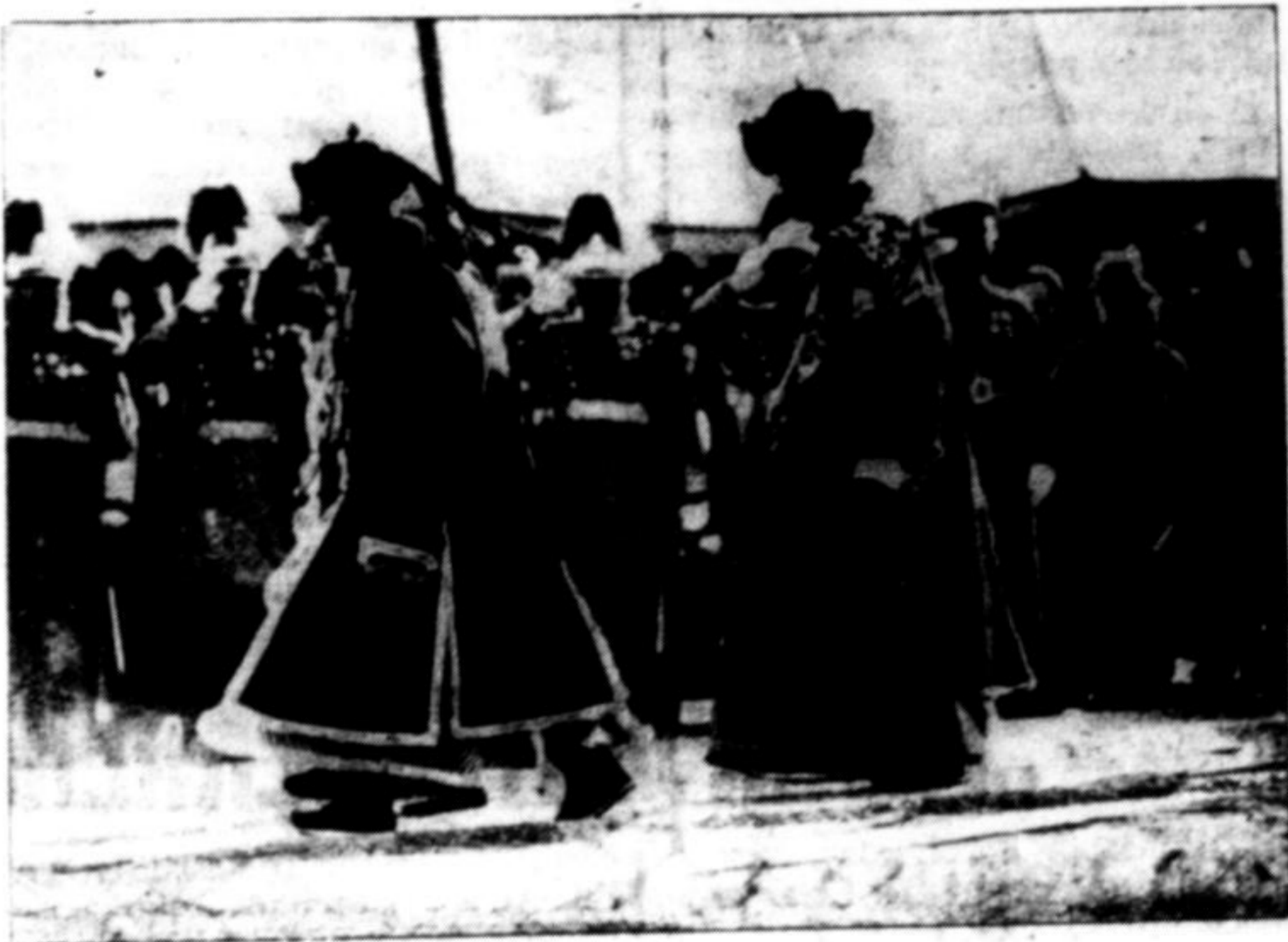
Пу-І, цсар Манджуко, нової держави під японським протекторатом, ринився поїхати на гроби своїх предків до нанкінського Китаю. Нанкін боїться, шойно Пу-І не прилучив до Манджуко нову частину Китаю. На нашому образку бачимо, як Пу-І переходить перед фронтом манджурського війська.

10-го березня ц. р. відбулося, як і що року, свято Шевченка в Гостинному, на Холмщині. В год. 9-ий відправлено Службу Богу, а ввечері панахиду. Після панахиди влаштували поминальну трапезу (без алькоголю), підчас якої виголосило реферати. На закінчення відспівано «Заповіт». 11-ого березня ц. р. старанням свідомої молоді відбулася панахидя по Шевченкові в селі Опарисах, на Дубенщині. Панахиду відслужив і сказав відповідне слово місцевий парох. Того дня мала відбутися й Академія, але на неї староство не дало дозволу. Того-ж дня врочиство відсвяткувало Шевченкові роковини с. Лаврів, на Лучині. Свято почалося Службою Божою, яку відслужив і сказав гарне слово про Шевченка о. М. Євчук. Вечором відбулася Академія в помешканню місцевої школи. Прочитано відповідні реферати, продекларовано вірші, відспівано пісні, а на закінчення виставлено пєсу «Тарас у дяка» і «В Тарасову ніч».