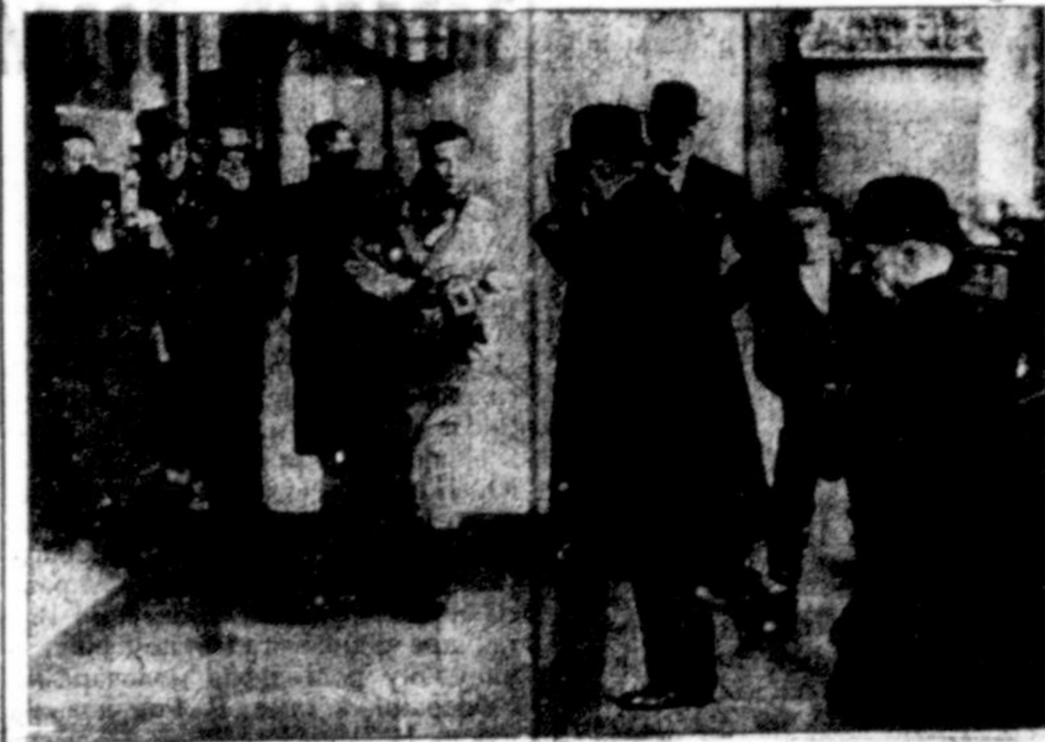
Франція тепер над берегом пропасти. Все наші зціналися в неї недавно заворушення, але припинилися. Прем'єром став міністр Думер, а міністром закордонних справ Барту. Ось два мужи мають зрятувати Францію в її прикрому положенні. На нашому образку бачимо, як міністр Барту переходить вулицю Парижа.