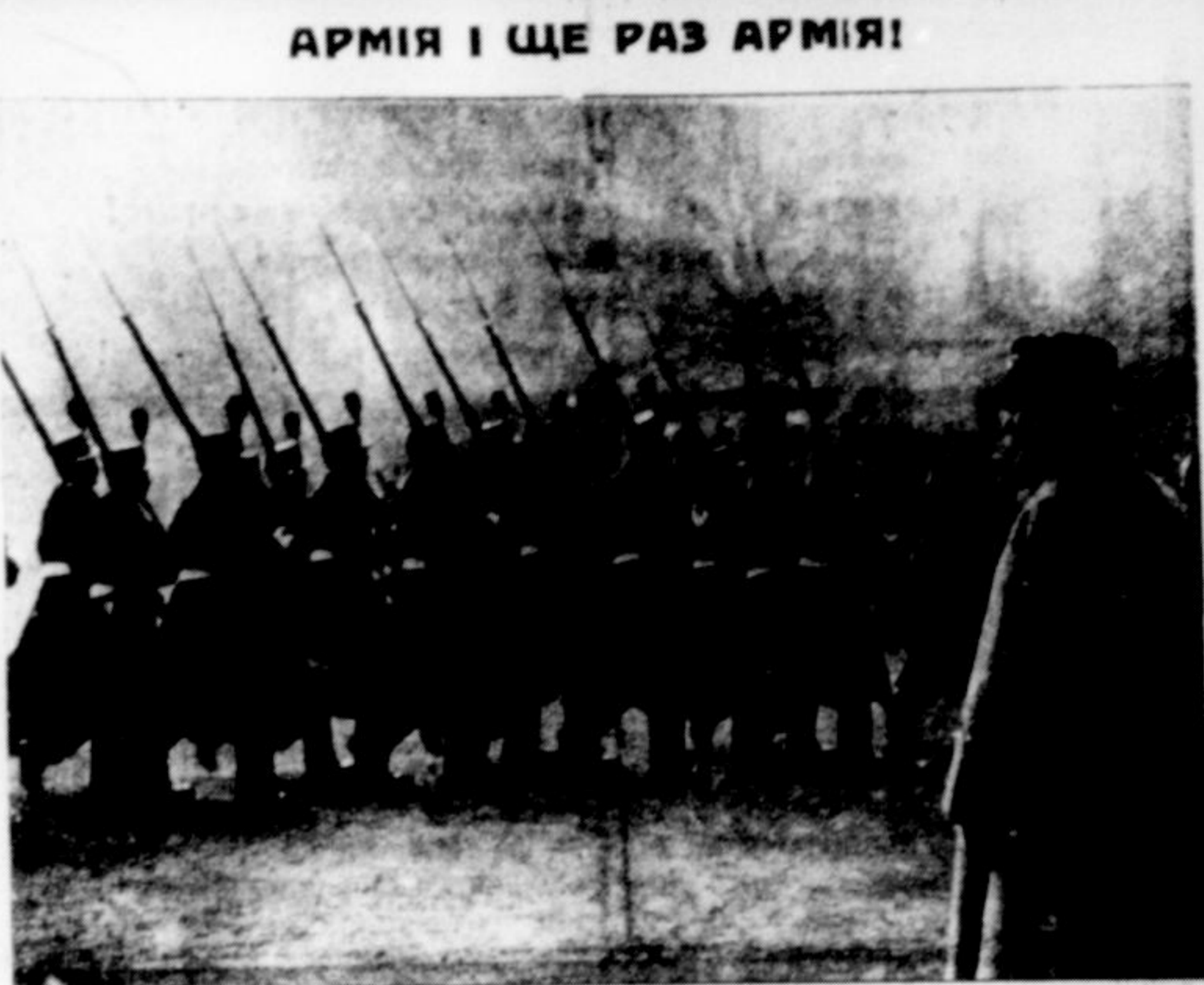
У звязку з різного роду надужиттям та обманствами у Франції завчася такий розклад, що, здавалося, не буде вже ніякого виходу. До нового уряду запросили славного з війни генерала Петєна. На нашому образку бачимо, як маршал Петєн, що є тепер міністром війни, приглядається почитному ходоу республіканської гвардії знагоди відкриття памятника Клемансо.

З 1-шим квітня ц. р. обовязує закон про те, що працєдавці в промислі, рільництві і комунікації є обовязані давати працю на 50 робітників чи працівників одному інвалідові, на кожних 100 робітників, чи працівників трьом інвалідам, що мають 15 до 65% загальної втрати зарібковій здібности. Закон обовязує також і при сезонних роботах. За невиконання є кара арешту до 6 тижнів або гривна від 200-2.000 золотих.