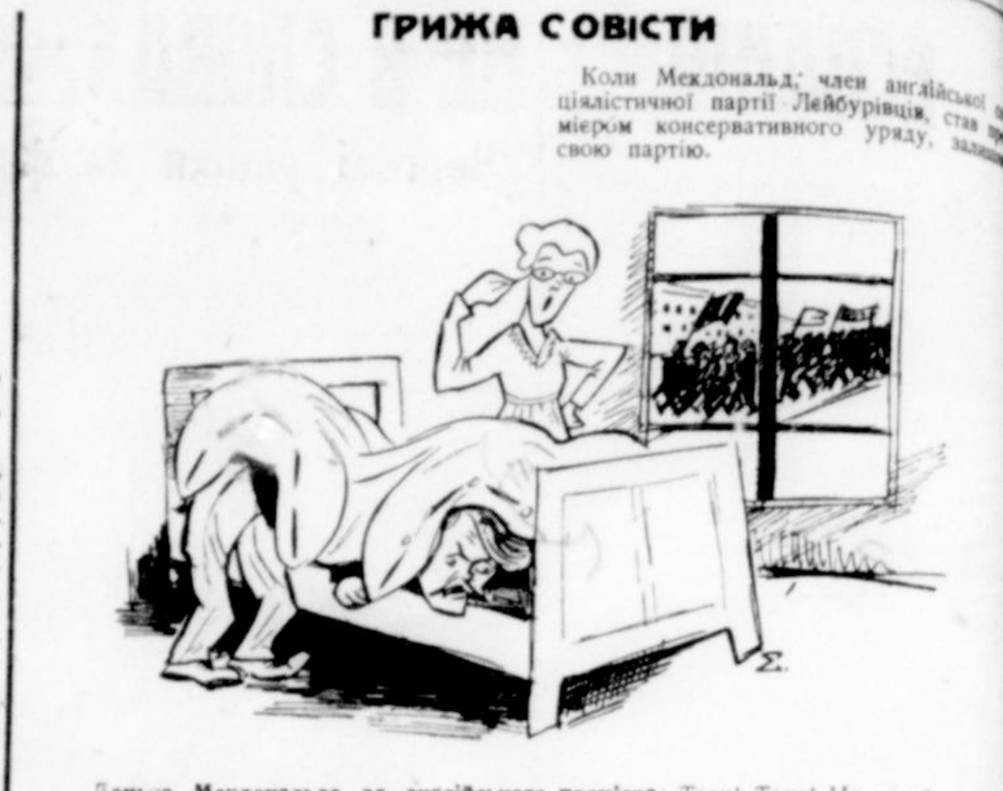
Донька Мекдональда до англійського прем'єра: Тату! Тату! Не ховайтесь! Так демонструють Ваші товариш-соціалісти...

Найблищої неділі звернувся він з просьбою до своєї братової, щоби навчила його грамоти. Вона ж радо погодилася.