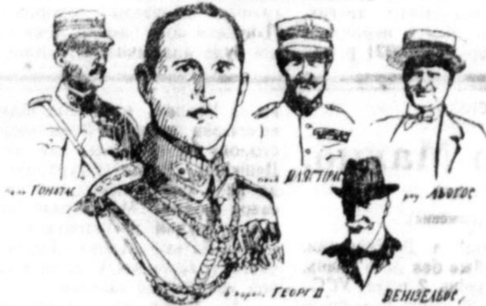
прогнаний король та грецькі державні мужі.