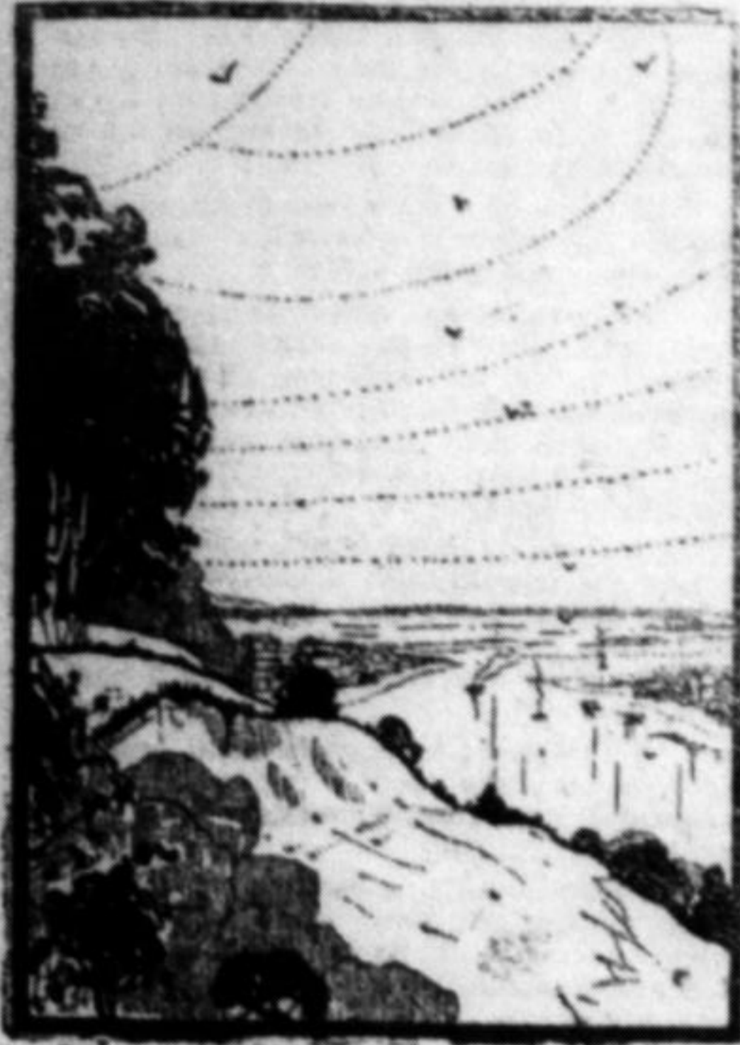
ВИДИ З КИІВА: Вид на Дніпро.

Не бавляться тільки ті, які ніколи і нігде не розкошують — правдивий пролстаріят.