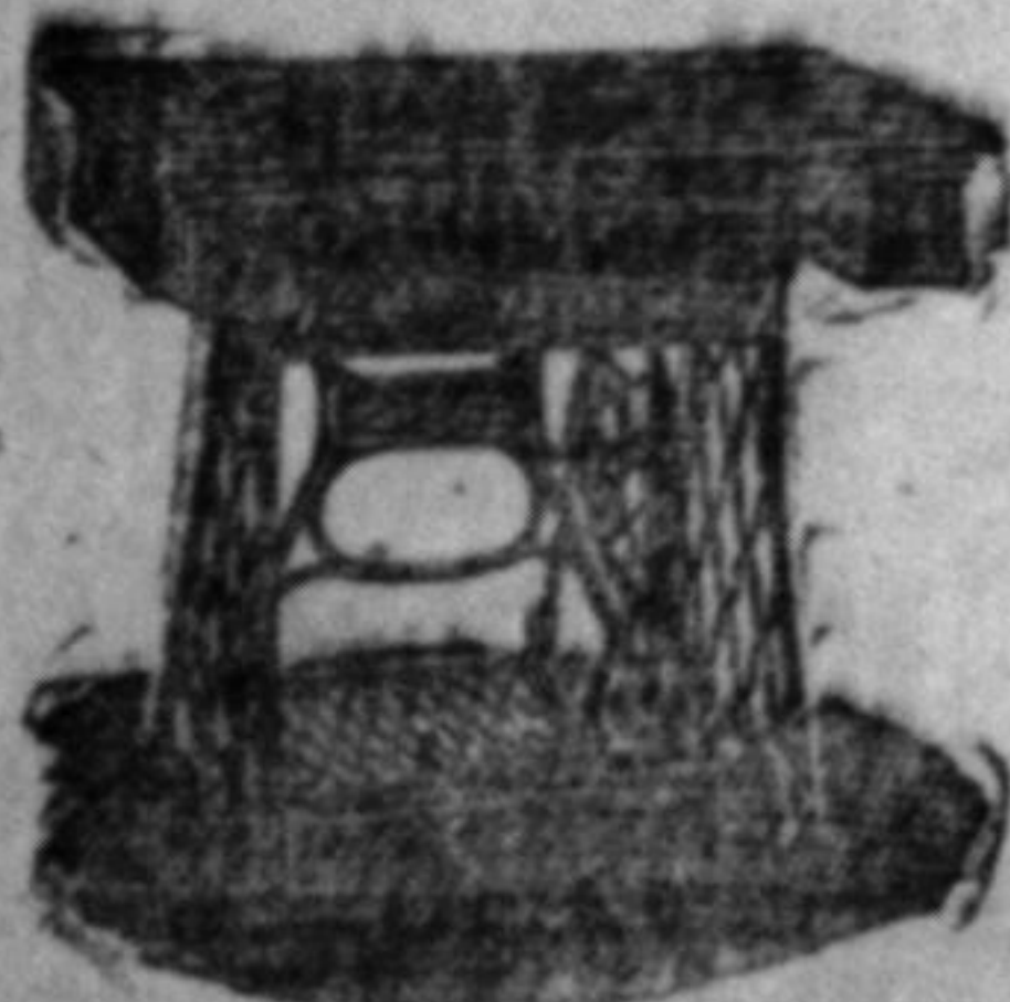
Maszyny do szycia »M-ladora«

Maszyny i narzędzia rolnicze Maszyny do szycia słanej marki »M-ladora«