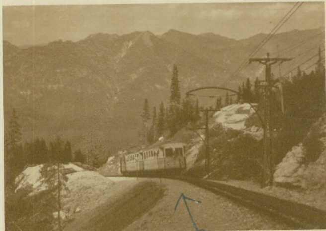
COMME EN ETÉ - Rode up on Tram