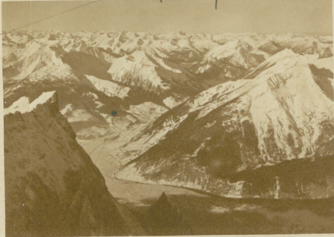
UTILISEZ TOUJOURS LA ZUGSPITZBAHN!

promenades dans toutes les directions. — Du Schneefernerhaus un téléphérique nous emporte en 4 minutes à peine au point culminant de l'Allemagne, au