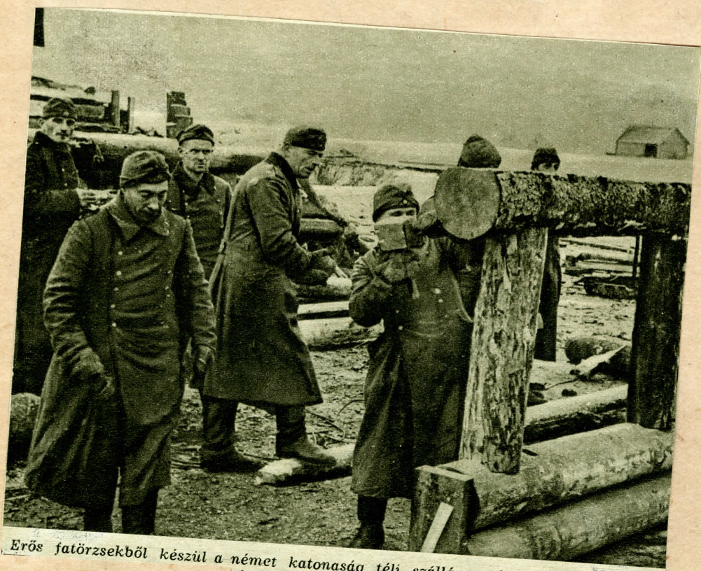
Erős fatörzsökből készül a német katonaság téli szállása a keleti fronton.

1941-XII-19 Bisher haben noch alle „Generale der Natur“, auf die der Feind im Kampf gegen die Achsenmächte immer wieder so große Hoffnungen gesetzt hatte, versagt. Auch mit dem „General Winter“, der ohne Zweifel an der Ostfront ein strenges Regiment führt, wird die deutsche Wehrmacht fertig werden