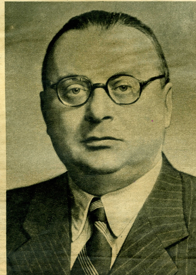
Antal István igazságügyminiszter, a vallás- és közoktatásügyi miniszteri teendők ellátásával is megbízva.