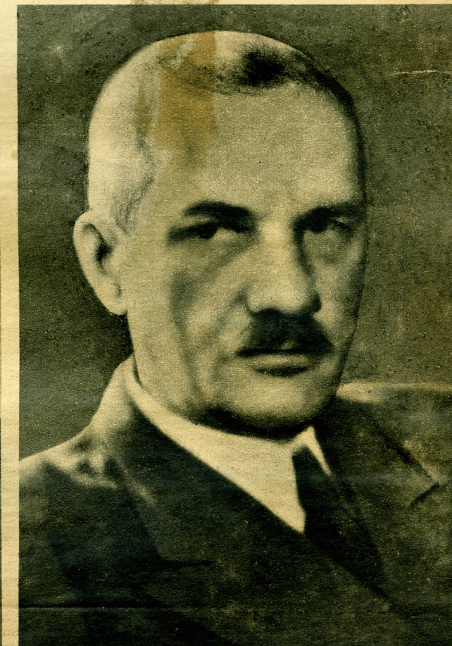
Jurcsák Béla földművelésügyi miniszter, a közellátásügyi miniszteri teendők ellátásával is megbízva.