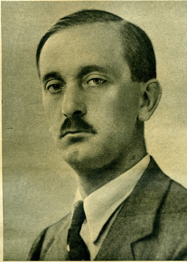
Kunder Antal kereskedelem- és közlekedésügyi miniszter.