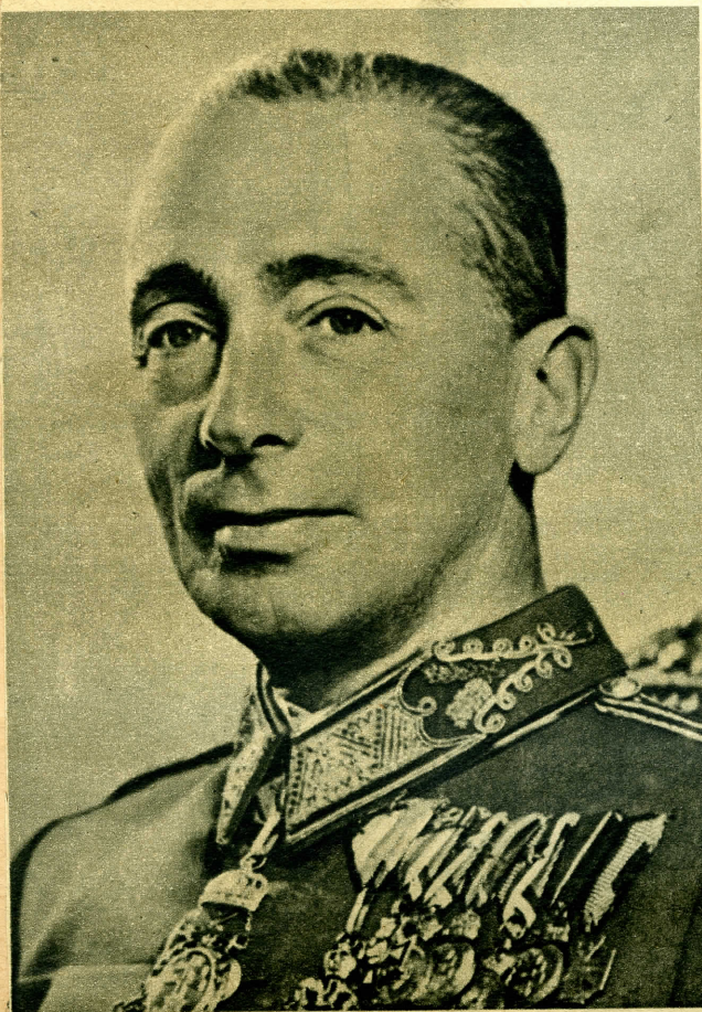
csataji Csatai Lajos honvédelmi miniszter.