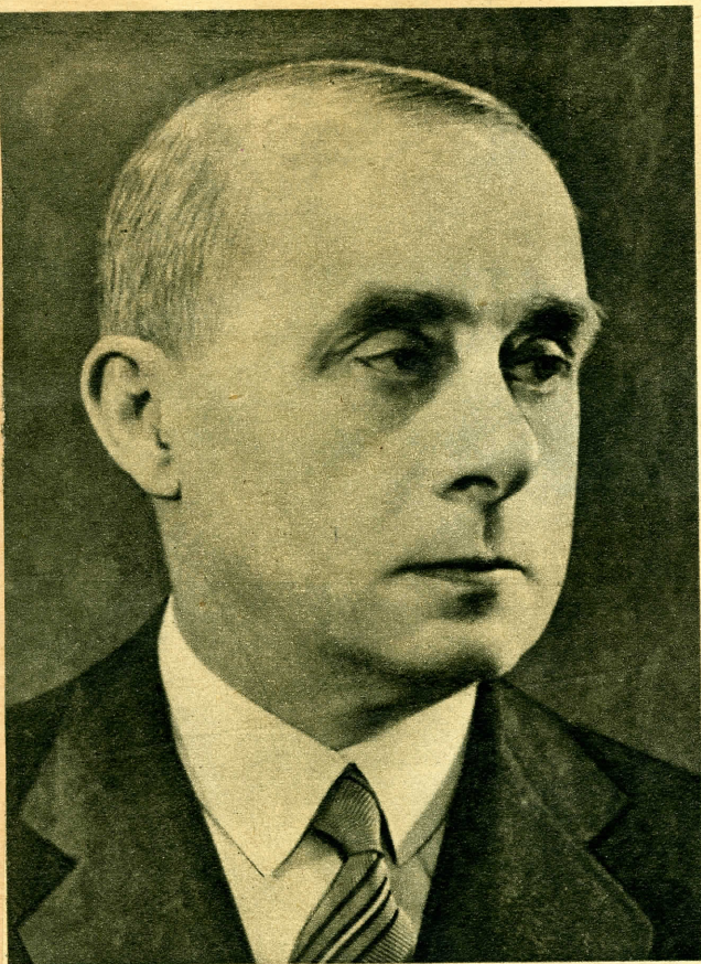
Sztójay Döme volt berlini magyar követ, az új kormányelnök és külügyminiszter.