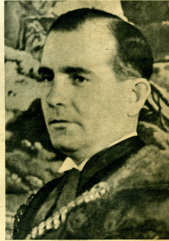
vitész Jaross Andor belügyminiszter.