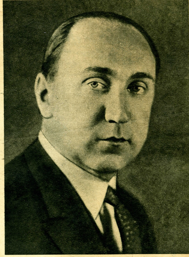
Reményi-Schneller Lajos, az új pénzügyminiszter.