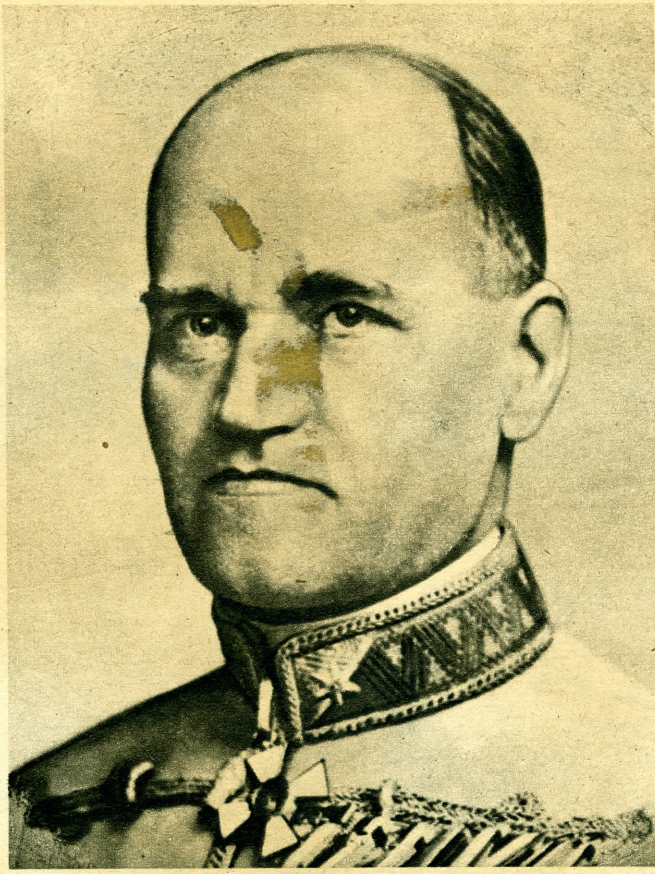
vitész nagylaki Rátz Jenő tárcanélküli miniszter, a miniszterelnök helyettese.