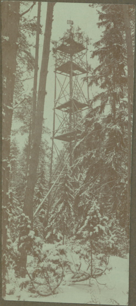
Hochstand bei Mossos.