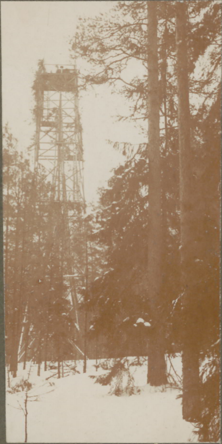
Hochstand bei Dillen.