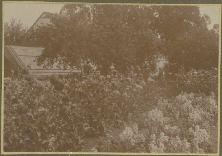
Im Park von Holswigshof 4/5 diema.