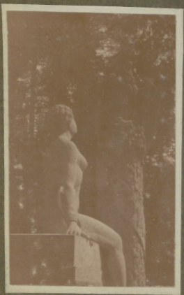
Das besetzte Xuland.