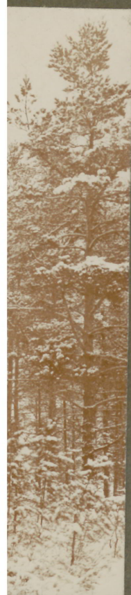
Trigonometrischer Punkt Oshokalm.