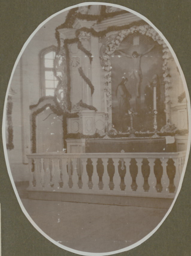
Altar der Kirche Burgalen.