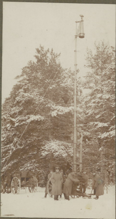
Mast für 20 h 2