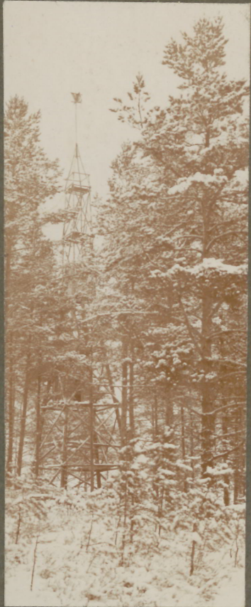
Trigonometrischer Punkt Oshkaln.