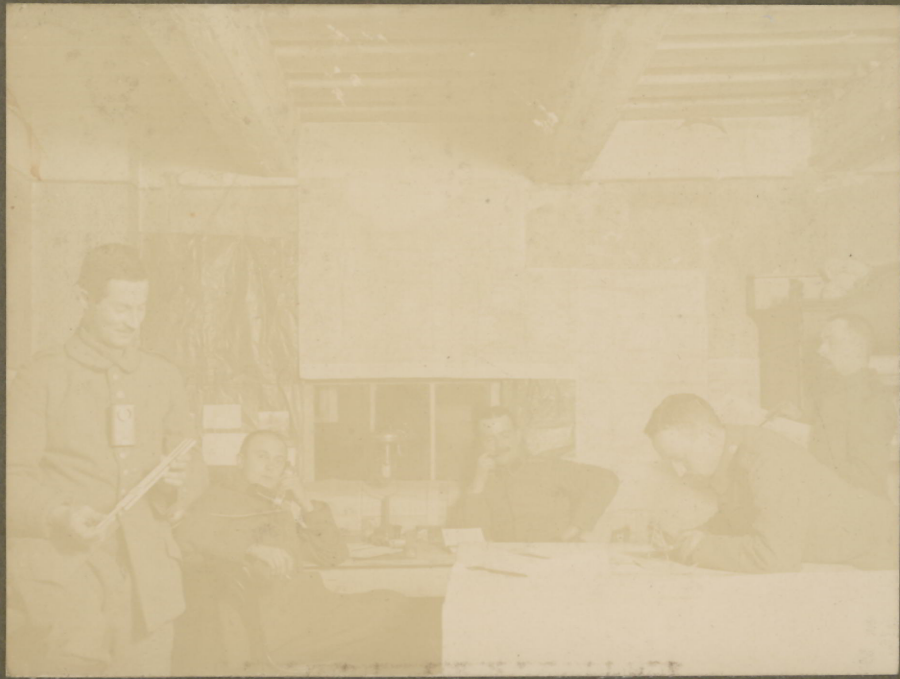
Centrale des Schallmess-Trupps 24.