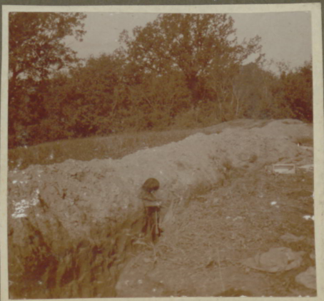
Der letzte Tappferer.