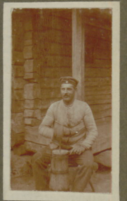
Frische Butter gefällig?