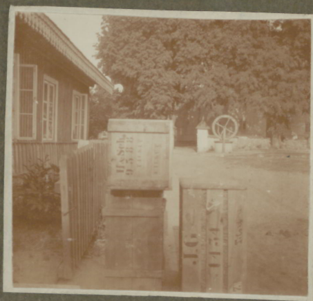
Weinkisten kommen an!