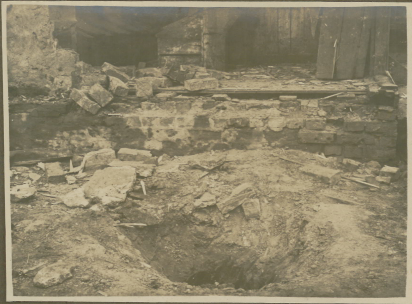
Bombenwurf in Mitau.