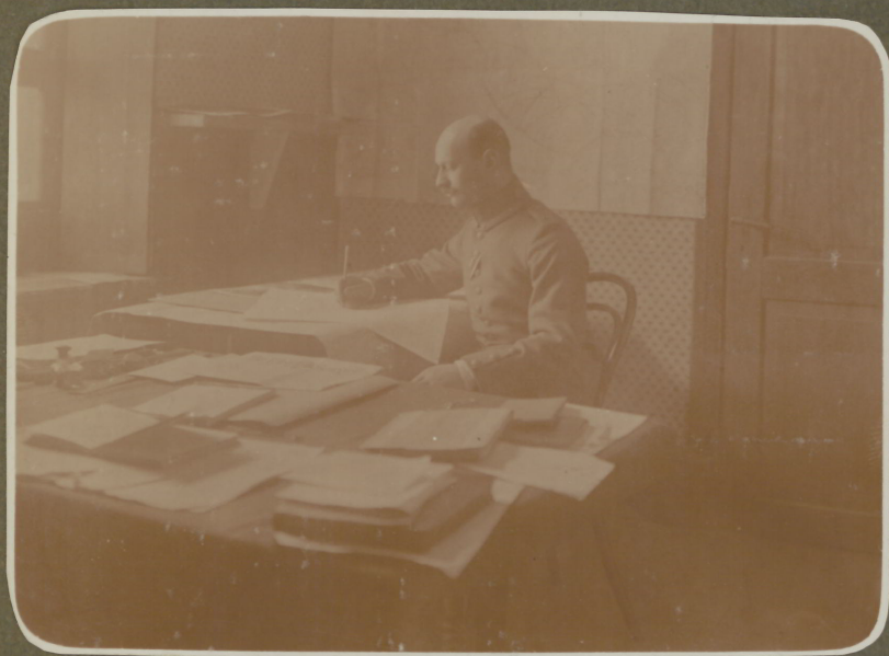
Der Herr Verpflegungsoffizier