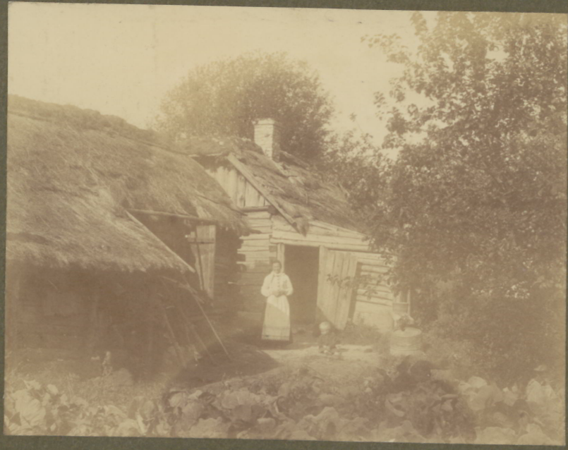
Panje - Villa.