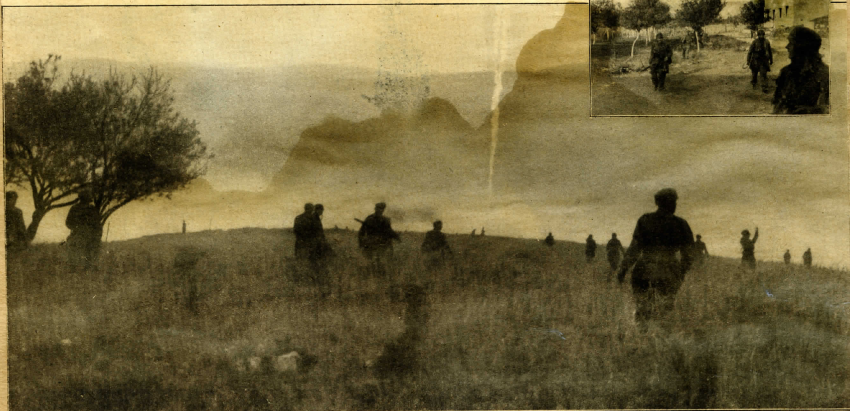
Am zweiten Tag: Das Unternehmen wird durchgeführt. Weiße Leuchtkugeln zeigen den 77-Fallschirmjägern die neue Angriffsrichtung.