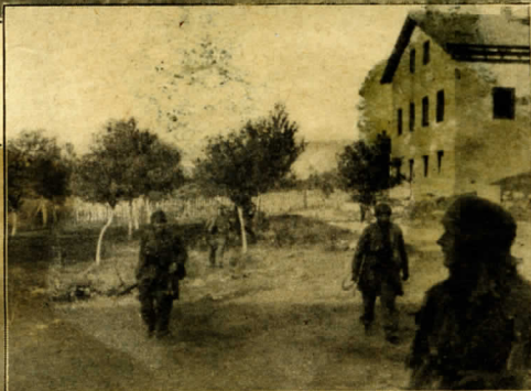
Rechts: Wieder sind einige Häuser von Banditen gesäubert.