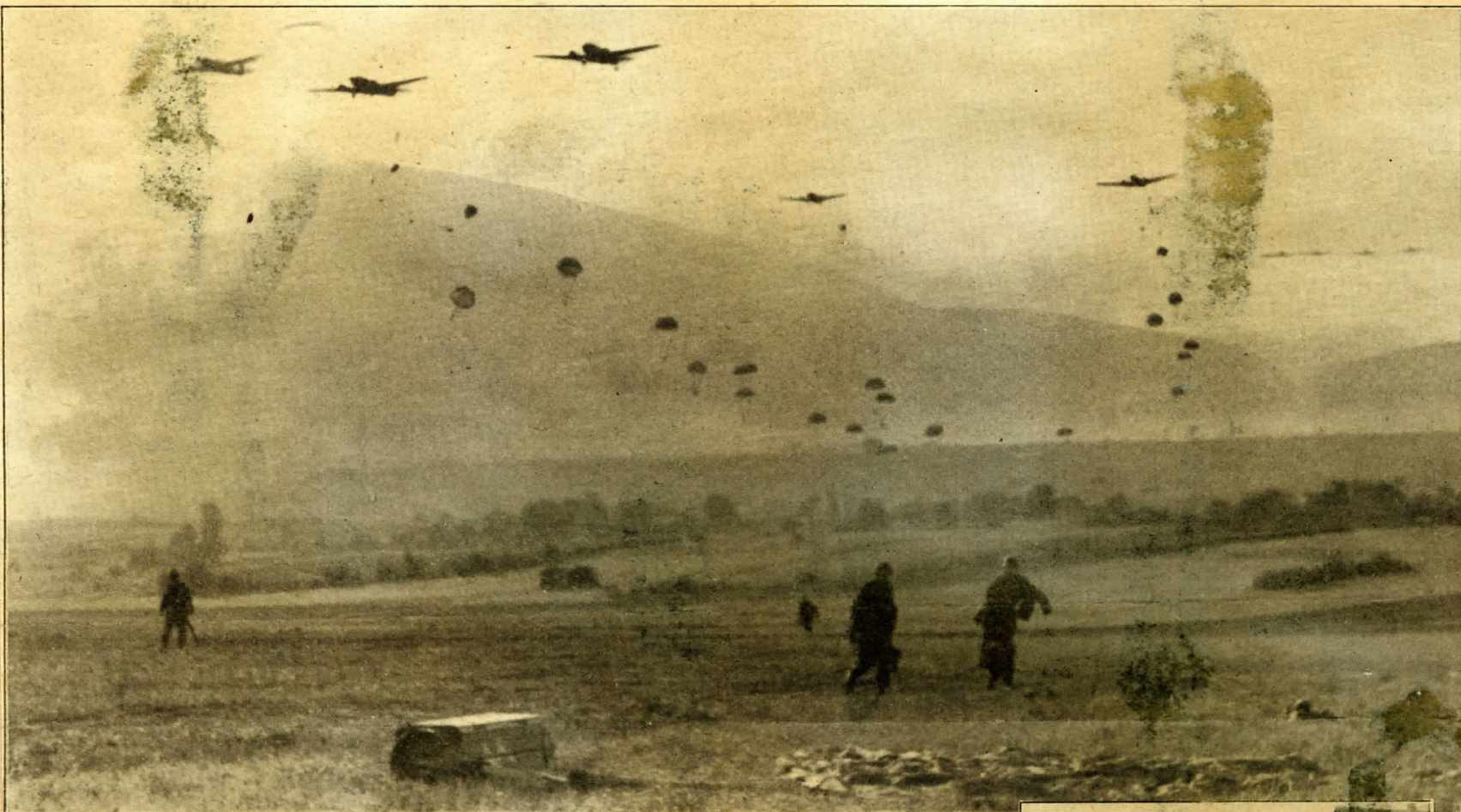
Eine Aktion deutscher 77-Fallschirmjäger beginnt. Die dritte und vierte Kette springt, während die schon gelandeten 77-Fallschirmjäger sich zum Angriff sammeln.

V or kurzem meldete der Wehrmachtbericht die Zerschlagung des Zentrums der Bandengruppen des Zuchthäuslers Josip Broz. In schweren Kämpfen, bei denen sich die 77. Gebirgsdivision „Prinz Eugen“ und das