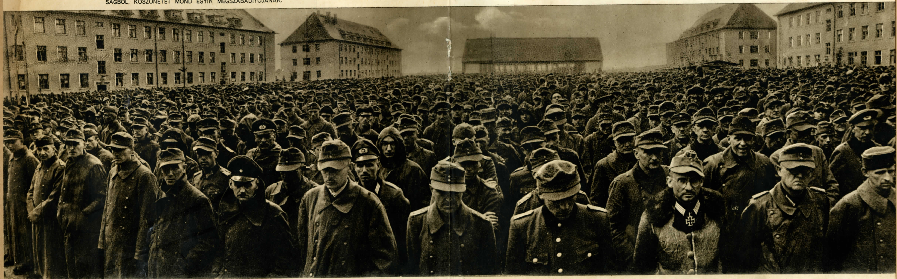
AZ Ő DICSTELEN ÚTJUK VÉGETÉRT...