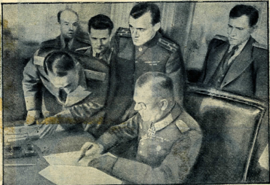
10. Генерал-фельдмаршал Кейтель подписывает акт о безоговорочной капитуляции германских вооружённых сил. Всё кончено для гитлеризма.