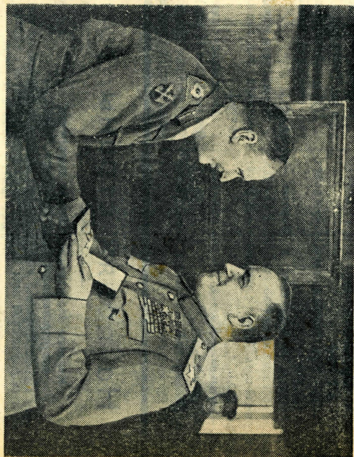
Встреча маршала Советского Союза Г. К. Жукова с генералом армии Дуайт Д. Эйзенхауэром и фельдмаршалом Бернардом Лоу Монтгомери. На снимках (слева направо): 1. Вручение ордена «Победа» маршалом Советского Союза Г. К. Жуковым генералу армии Дуайт Д. Эйзенхауэру. 2. Маршал Советского Союза Г. К. Жуков вручает ордена «Победа» фельдмаршалу Бернаду Лоу Монтгомери.