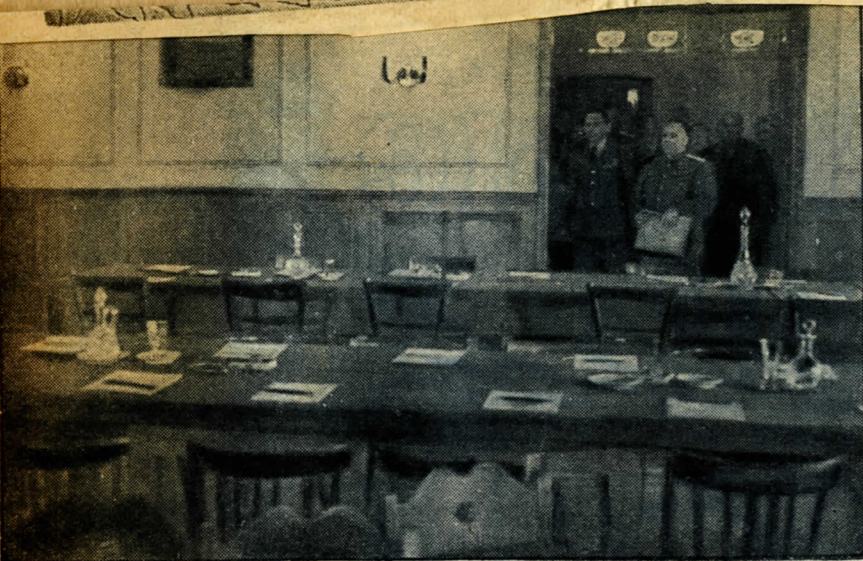
7. Маршал Советского Союза Жуков и главный маршал авиации Теддер входят в зал. Наступают исторические мгновения, которых ждут все народы.