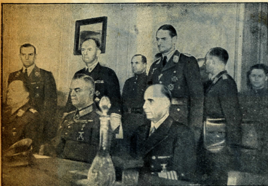
9. Вот они входят и занимают указанные им места. Они пытаются сохранить надменность и высокомерие, но это им не удастся. Жалкие банкроты!