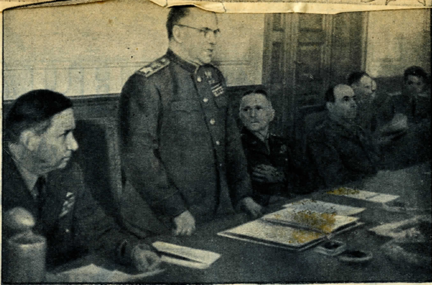
8. Маршал Советского Союза Жуков поднимается со своего места и объявляет, что представители германского верховного командования могут войти.