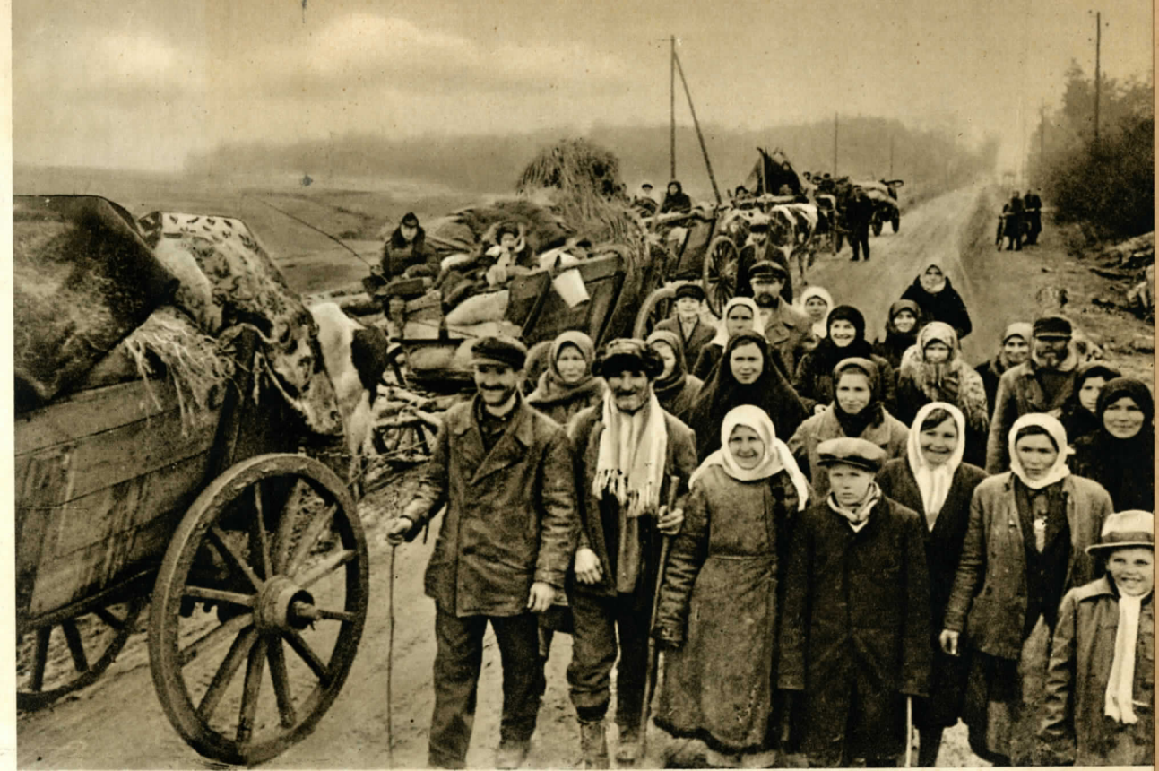
SZMOLENSZKI PARASZTOK, HÁROM ÉVES RABSÁG UTÁN, HAZAFELÉ.