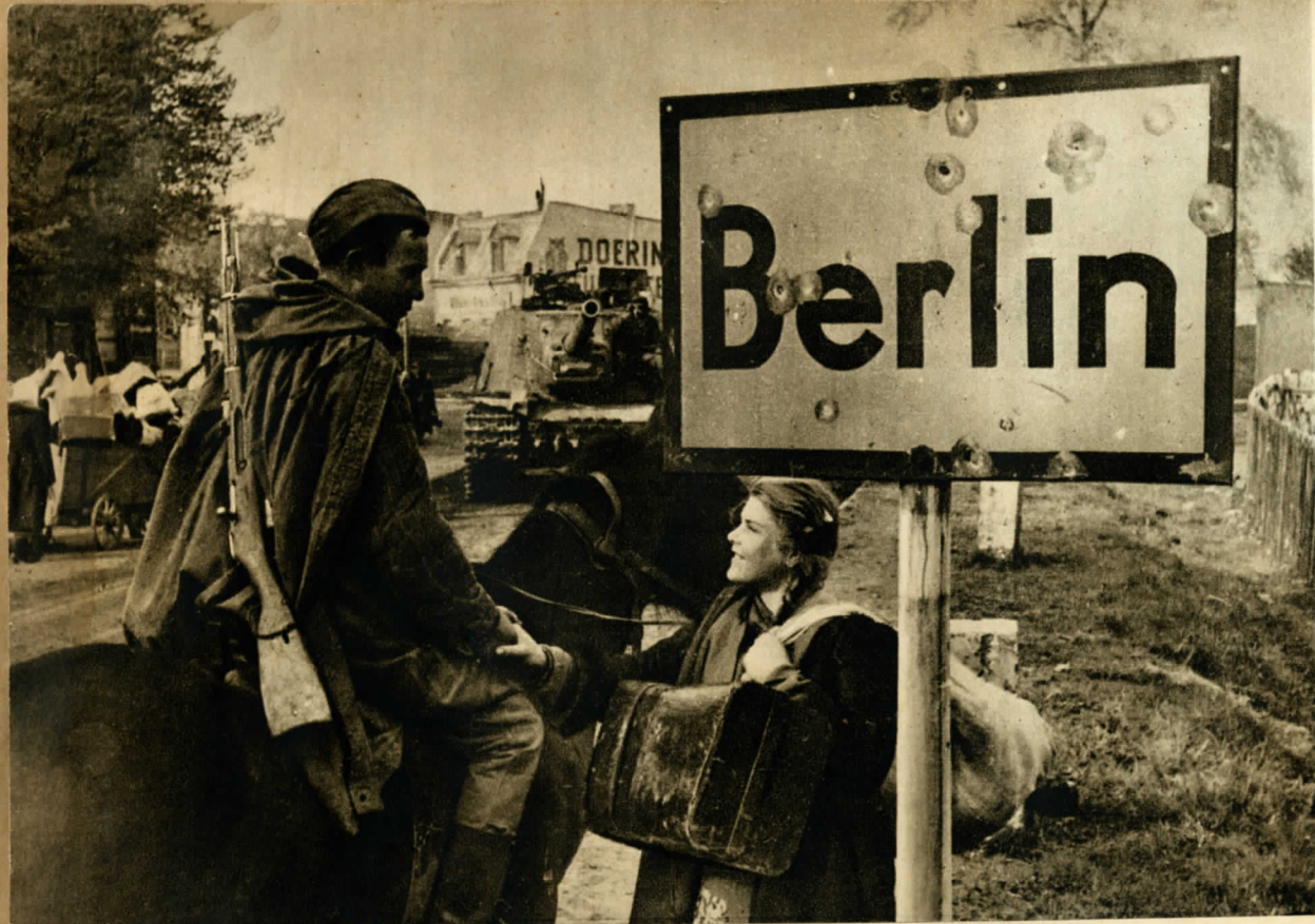
BERLIN FELÉ. EGY FIATAL OROSZ LEÁNY, AKIT A VÖRÖS HADSEREG ELŐNYOMULÁSA MENTETT KI A NÉMET RABSZOLGASÁGBÓL. KÖSZÖNETET MOND EGYIK MEGSZABADÍTÓJÁNAK.