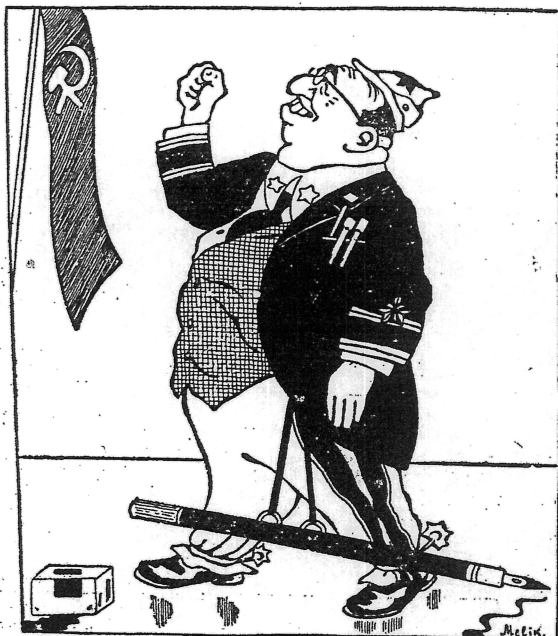
Від імені новозазначених генералів присягаю боротися до останнього червоноармієць