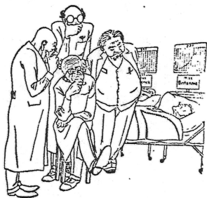
Постійне лікарське консилиум у справі баці „Підводні човни“.