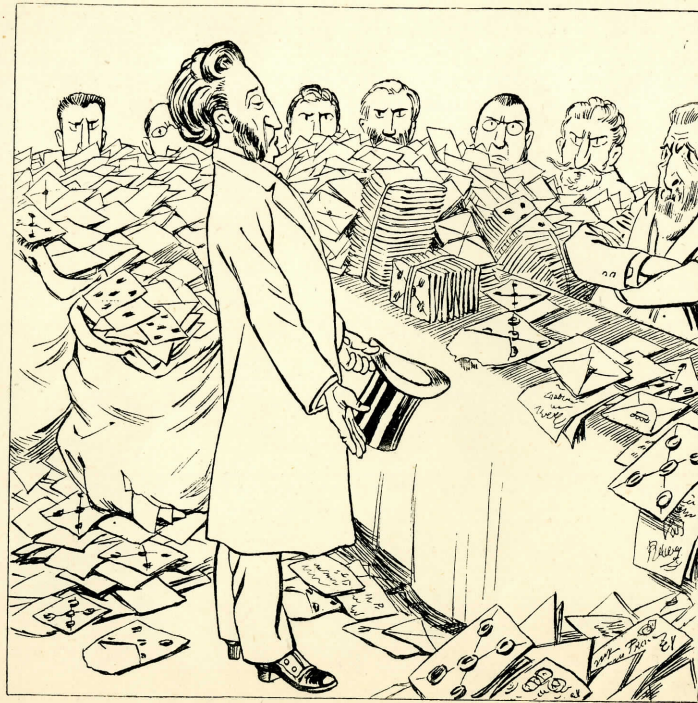
DEVANT LA COMMISSION D'ENQUÊTE