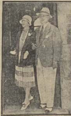
Znany niemiecki aktor filmowy Emil Jannings według jednego z ostatnich zdjęć.