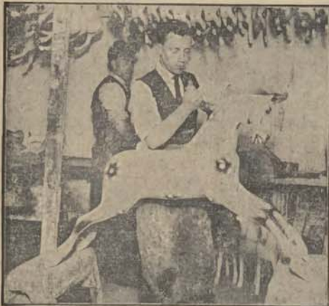
Gorączkowa praca przed świętami Bożego Narodzenia.