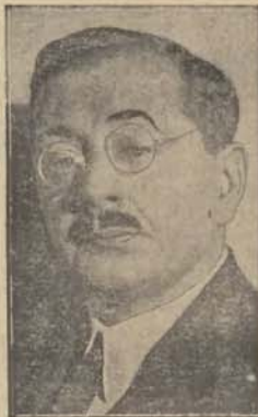
obchodził jubileusz 25-letniej pracy literackiej. W dzień jubileuszu gro no przyjaźni znakomitego pisarza uczcilo go bankietem, urządzonym na Jego cześć, wręczając Mu równocześnie szereg upominków.