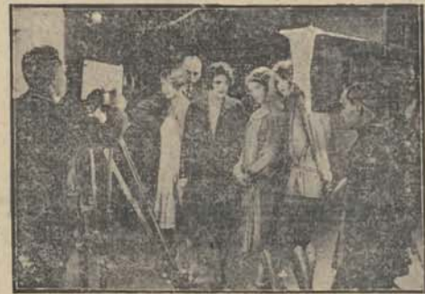
przed obiektywem kinooperatora