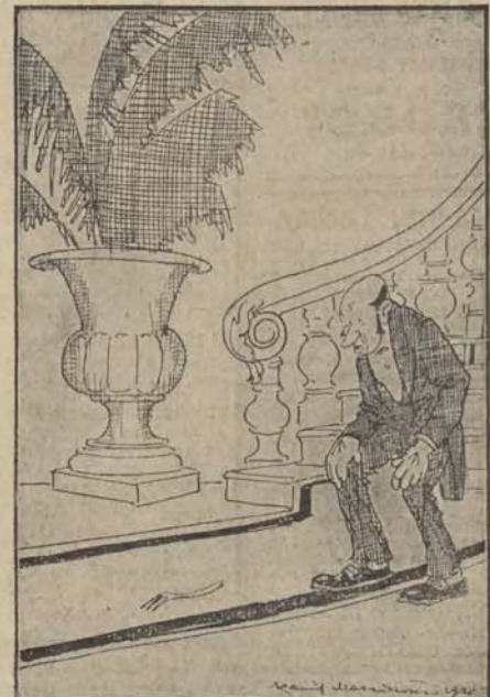
— (Do) mi, i jeszcze w godzinie miał dziurawą kieszonkę.

SEKRETARZ REDAKCJI PRZYJMUJE OD 6 — 7 W.